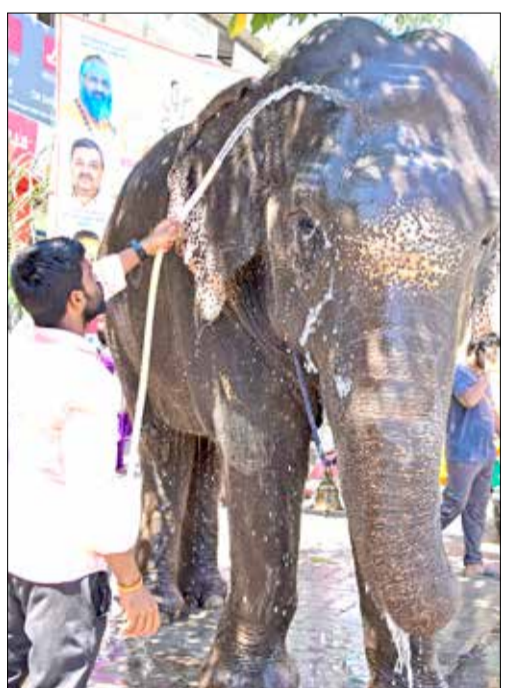
ದಾವಣಗೆರೆ: ಶ್ರೀ ರೇಣುಕಾಚಾರ್ಯ ಭಾವಚಿತ್ರದ ಸಾರೋಟಿ ಉತ್ಸವಕ್ಕೆ ಕರೆ ತಂದಿದ್ದ ಗಜರಾಜನಿಗೆ ಮಾವುತ ಸ್ನಾನ ಮಾಡಿಸುತ್ತಿರುವುದು. ಬಿಸಿಲಿನ ಬೇಗೆಗೆ ಮನುಷ್ಯರಷ್ಟೇ ಅಲ್ಲ, ಗಜರಾಜನೂ ಬಸವಳಿದಿದ್ದನೇನೋ.

ಪೋಷಕರು ಮತ್ತು ಹಿರಿಯ ನಾಗರಿಕರ ನಿರ್ವಹಣೆ ಮತ್ತು ಕಲ್ಯಾಣ ಕಾಯ್ದೆಯಡಿ ಅವಕಾಶ