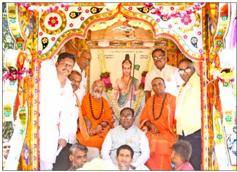
ದಾವಣಗೆರೆ, ಮಾರ್ಚ್ 12- ಶ್ರೀ ಆದಿ ಜಗದ್ಗುರು ಶ್ರೀ ಮಧ್ವೇಶ್ವರ ಮಹಾಪುತ್ರ ಸ್ವಾಮೀಶ್ವರರಾದ ಶ್ರೀ ಆದಿ ಜಗದ್ಗುರು ರೇಣುಕಾಚಾರ್ಯರ ಜಯಂತಿ ಹಿನ್ನೆಲೆಯಲ್ಲಿ ಶ್ರೀ ರೇಣುಕಾಚಾರ್ಯರ ಭಾವಚಿತ್ರದ ಸಾರೋಟ ಉತ್ಸವವು ಶ್ರೀ ಶೈಲ ಮಠದಿಂದ ರೇಣುಕಾ ಮಂದಿರದವರಿಗೆ ನಡೆಯಿತು.