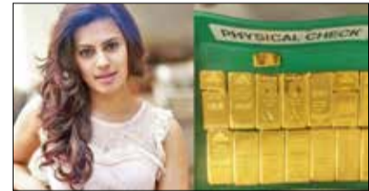
ಚಿನ್ನ ಕಳ್ಳಸಾಗಣೆಗೆ ಪ್ರಕರಣ ಸಿಬಿಐಗೆ

ಯಾವುದೇ ಪ್ರಕರಣವನ್ನು ಸಿಬಿಐ ತನಿಖೆಗೆ ಮುಕ್ತ ಅವಕಾಶ ನೀಡದಿರುವ ಕರ್ನಾಟಕ ಸರ್ಕಾರದ ನಿರ್ಧಾರದ ಹಿನ್ನೆಲೆಯಲ್ಲಿ ಕಂದಾಯ ಇಲಾಖೆಯ