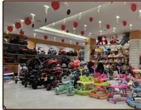
INFANTS & TOYS