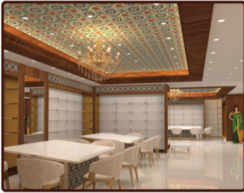
SILK & FANCY SAREES