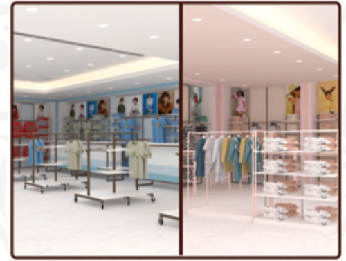
KIDS BOYS & GIRLS