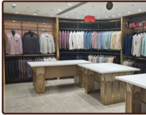
MEN'S ETHNIC WEAR