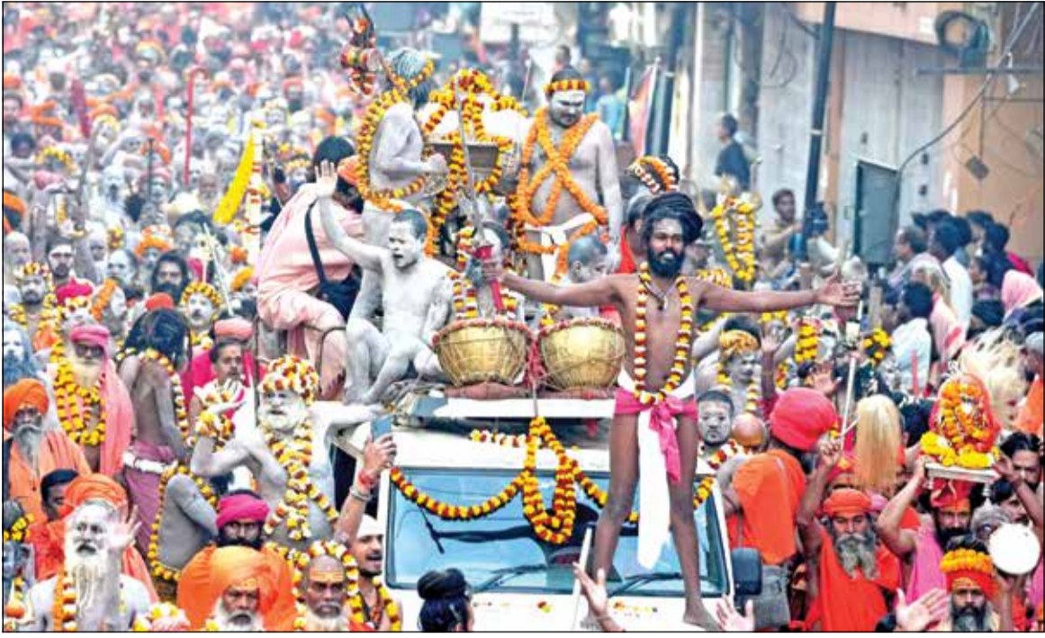
ಮಹಾಶಿವರಾತ್ರಿಯಂದು ವಾರಣಾಸಿ : ಮಹಾಶಿವರಾತ್ರಿ ದಿನದಂದು ಮಹಾಕುಂಭಮೇಳ ಪೂರ್ಣಗೊಂಡ ಹಿನ್ನೆಲೆಯಲ್ಲಿ, ಕಾಶಿ ವಿಶ್ವನಾಥ ದೇವಾಲಯದಲ್ಲಿ ಪೂಜೆ ಸಲ್ಲಿಸಲು ಮೆರವಣಿಗೆಯಲ್ಲಿ ತೆರಳುತ್ತಿರುವ ನಾಗಾ ಸಾಧುಗಳು.