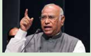
ಸಚಿವ, ಶಾಸಕರಿಗೆ ಖರ್ಗೆ ಖಡಕ್ ಎಚ್ಚರಿಕೆ

ಬೆಂಗಳೂರು, ಫೆ. 21 - ಪಕ್ಷಕ್ಕೆ ಮಾರಕ ಆಗುವಂತಹ ಹೇಳಿಕೆಗಳನ್ನು ನಿಲ್ಲಿಸದಿದ್ದರೆ ಮಂತ್ರಿ ಸ್ಥಾನ ತೊರೆದು ಮನೆಗೆ ಹೋಗಿ ಎಂದು ಎಂಪಿಎಸ್ ಅಧ್ಯಕ್ಷ ಮಲ್ಲಿಕಾರ್ಜುನ ಖರ್ಗೆ ಕರ್ನಾಟಕದ ಕೆಲವು ಸಚಿವರುಗಳಿಗೆ ಖಡಕ್ ಎಚ್ಚರಿಕೆ ನೀಡಿದ್ದಾರೆ.