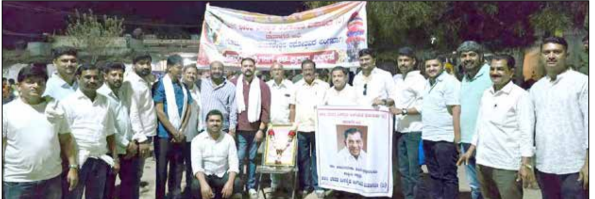
ದಾವಣಗೆರೆ, ಫೆ.20- ಕೋಟ್ಟೂರು ಪಾದಯಾತ್ರಿ ಕೈಗೊಂಡಿರುವ ಭಕ್ತಾದಿಗಳಿಗೆ ಅಶಿಲ ಭಾರತ ವೀರಶೈವ ಮಹಾಸಭಾದ ಜಿಲ್ಲಾ ಘಟಕದ ವತಿಯಿಂದ ನೀರು, ಮಜ್ಜಿಗೆ, ಕಲ್ಲಂಗಡಿ ಹಣ್ಣುಗಳನ್ನು ಇಂದು ವಿತರಿಸಲಾಯಿತು. ಮಹಾಸಭಾದ ಜಿಲ್ಲಾ ಘಟಕದ ಎಲ್ಲಾ ಪಾದಯಾತ್ರಿಗಳು ಈ ಸಂದರ್ಭದಲ್ಲಿ ಉಪಸ್ಥಿತರಿದ್ದರು.