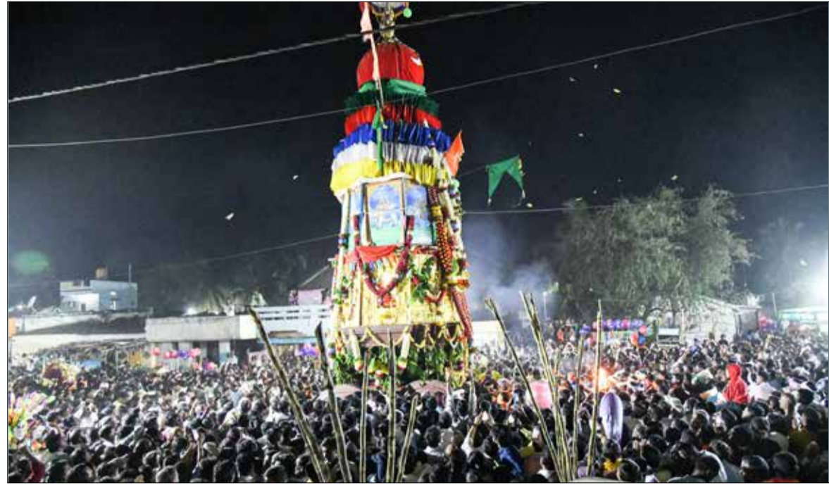
ಈರಣ್ಣನ ತೇರು .. ದಾವಣಗೆರೆ ತಾಲ್ಲೂಕು ಆವರಣದಲ್ಲಿ ಗ್ರಾಮದಲ್ಲಿ ಶ್ರೀ ವೀರಭದ್ರೇಶ್ವರ ಸ್ವಾಮಿ ಚಾತುರ್ಯ ಸೋಮವಾರ ಸಂಜೆ ಅಪಾರ ಭಕ್ತರ ಸಮ್ಮುಖದಲ್ಲಿ ಆದ್ಯಂತಿಯಾಗಿ ನೆರವೇರಿತು.

ಸಂಪುಟ : 51 ಸಂಚಿಕೆ : 277 ☎ 08192-254736 📞 91642 99999 RNI No: 27369 ಪುಟ : 6 ರೂ : 5.00 🌐 www.janathavani.com ✉ janathavani@mac.com