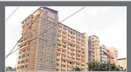
ಆಧುನಿಕ ತಂತ್ರಜ್ಞಾನ ಹಾಗೂ ಪಾರಂಪರಿಕ ವಾಸ್ತುಶಿಲ್ಪದೊಂದಿಗೆ ನಿರ್ಮಿಸಲಾಗಿರುವ 13 ಅಂತಸ್ತುಗಳ ಮೂರು ಸ್ಟಾವರ್ಗಳು

ನವದೆಹಲಿ, ಫೆ. 12 - ಆರ್.ಎಸ್.ಎಸ್ ಮರು ನಿರ್ಮಾಣಗೊಂಡಿರುವ ತನ್ನ ಹಳೆಯ ವಿಳಾಸಕ್ಕೆ ಮರಳಿದೆ. ದೆಹಲಿಯ 3.75 ಎಕರೆ ಪ್ರದೇಶದಲ್ಲಿ 13 ಅಂತಸ್ತುಗಳ ಮೂರು ಸ್ಟಾವರ್ಗಳನ್ನು ನಿರ್ಮಿಸಲಾಗಿದೆ. ಇವು ಒಟ್ಟು 300 ಕೋಟಿಗಳು ಹಾಗೂ ಕಚೇರಿಗಳನ್ನು ಹೊಂದಿವೆ.