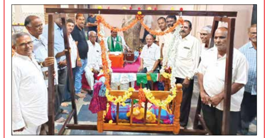
ಕೊಟ್ಟೂರೇಶ್ವರ ಸ್ವಾಮಿ ಪುರಾಣ ಪ್ರವಚನದಲ್ಲಿ ತೊಟ್ಟಿಲು ಪೂಜೆ ದಾವಣಗೆರೆ, ಫೆ. 10 - ನಗರದ ವೀರಕೃಪವನದ ಅವರಣದಲ್ಲಿ ಶ್ರೀ ಕೊಟ್ಟೂರು ಗುರುಬಸವೇಶ್ವರ ಪುರಾಣ ಪ್ರವಚನ ನಡೆಯುತ್ತಿದ್ದು, ಇಂದಿನ ಪ್ರವಚನದಲ್ಲಿ ಬಾಲಕ ಶ್ರೀ ಗುರು ಕೊಟ್ಟೂರೇಶ್ವರ ಸ್ವಾಮಿಗ ತೊಟ್ಟಿಲು ಪೂಜೆ ನಡೆಯಿತು. ಈ ಸಂದರ್ಭದಲ್ಲಿ ಮಹಿಳೆಯರು, ಗಣ್ಯರು ಪೂಜೆ ಸಲ್ಲಿಸಿದರು.