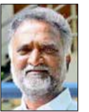
ಪಾರದರ್ಶಕ ಮನೆ ಹಂಚಿಕೆಗೆ ಶಾಸಕರ ತಾಕೀತು

ದಾವಣಗೆರೆ, ಫೆ. 3 - ಮಾಯಕೊಂಡ ವಿಧಾನ ಸಭಾ ಕ್ಷೇತ್ರದ ವ್ಯಾಪ್ತಿಯ ದಾವಣಗೆರೆ ತಾಲ್ಲೂಕಿಗೆ 506, ಚನ್ನಗಿರಿ ತಾಲ್ಲೂಕಿಗೆ 244 ಸೇರಿ ಕ್ಷೇತ್ರಕ್ಕೆ ಒಟ್ಟು 750 ಮನೆಗಳು ಮಂಜೂರಾಗಿವೆ ಎಂದು ಶಾಸಕ ಕೆ.ಎಸ್. ಬಸವಂತಪ್ಪ ತಿಳಿಸಿದ್ದಾರೆ. ನಿರ್ಗತಿಕರು, ಬಡವರಿಗೆ ಸೂರು ಕಲ್ಪಿಸಲು ಸರ್ಕಾರ ಮತ್ತು ವಸತಿ ಸಚಿವರ ಮೇಲೆ ಒತ್ತಡ ಹಾಕಿ ಮನೆಗಳನ್ನು ಮಂಜೂರು ಮಾಡಿಸಲಾಗಿದೆ. ಕ್ಷೇತ್ರದ ವ್ಯಾಪ್ತಿಯ ದಾವಣಗೆರೆ ತಾಲ್ಲೂಕಿನ ವ್ಯಾಪ್ತಿಗೆ ಬರುವ ಗ್ರಾಮ ಪಂಚಾಯತಿಗಳಿಗೆ 2022-23ನೇ ಸಾಲಿನ ಡಾ. ಬಿ.ಆರ್. (4ನೇ ಪುಟಕ್ಕೆ)