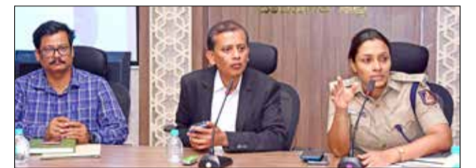
2 ಲಕ್ಷ ರೂ. ವರೆಗೆ ಮಾತ್ರ ಸಾಲ ನೀಡಲು ಅವಕಾಶ ಗರಿಷ್ಠ ಶೇ.18ಕ್ಕಿಂತ ಹೆಚ್ಚು ಬಡ್ಡಿ ವಸೂಲಿ ಮಾಡುವಂತಿಲ್ಲ ನೀಡಿದ ಸಾಲ ಬಾಕಿ ವಸೂಲಿ ವೇಳೆ ಕೆವೈಸಿ ಕೇಳುವಂತಿಲ್ಲ ಬಿ.9 ರಿಂದ ಸಂಜೆ 6ರ ವರೆಗೆ ಮಾತ್ರ ಸಾಲ ವಸೂಲಿ ರಾಡಿಗಳನ್ನು ಬಿಟ್ಟು ದಬ್ಬಾಳಿಕೆ ಮಾಡುವಂತಿಲ್ಲ