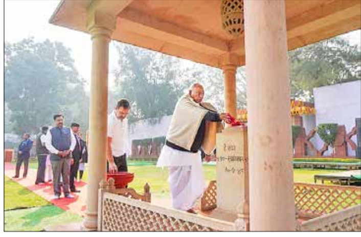
ಮಹಾತ್ಮರಿಗೆ ನಮನ ...