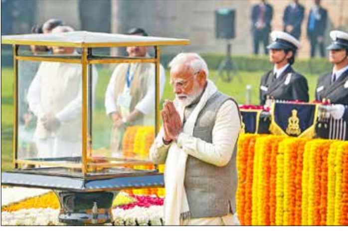
ನವದೆಹಲಿಯ ಗಾಂಧಿ ಸ್ಮಾರಕದಲ್ಲಿ ರಾಷ್ಟ್ರಪತಿ ಅವರ ಪುಣ್ಯಾರ್ಥಿಯ ಅಂಗವಾಗಿ ಕಾಂಗ್ರೆಸ್ ಅಧ್ಯಕ್ಷ ಮಲ್ಲಿಕಾರ್ಜುನ ಖರ್ಗೆ ಅವರು ಹುತಾತ್ಮರ ದಿನದಂದು ಮಹಾತ್ಮ ಗಾಂಧಿ ಅವರಿಗೆ ಗೌರವ ನಮನ ಸಲ್ಲಿಸಿದರು. ಲೋಕಸಭೆಯ ವಿರೋಧ ಪಕ್ಷದ ನಾಯಕ ರಾಹುಲ್ ಗಾಂಧಿ ಸಹ ಇದ್ದಾರೆ. ರಾಜ್‌ಘಾಟ್‌ನಲ್ಲಿ ಪ್ರಧಾನಿ ನರೇಂದ್ರ ಮೋದಿ ಅವರು ಮಹಾತ್ಮ ಗಾಂಧಿ ಅವರಿಗೆ ಗೌರವ ಸಲ್ಲಿಸಿದರು. (ಬುಲೆಟ್)