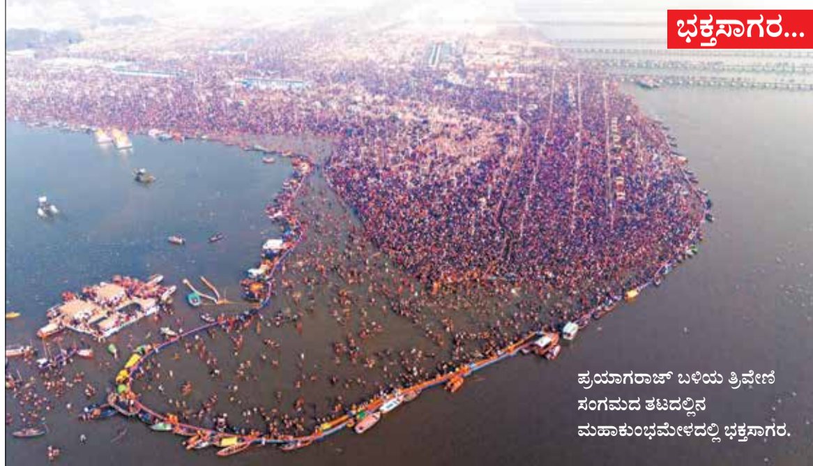
ಭಕ್ತಸಾಗರ... ಪ್ರಯಾಗರಾಜ್ ಬಳಿಯ ತ್ರಿವೇಣಿ ಸಂಗಮದ ತಟದಲ್ಲಿನ ಮಹಾಕುಂಭಮೇಳದಲ್ಲಿ ಭಕ್ತಸಾಗರ.

ನ್ಯಾಯಮೂರ್ತಿಗಳಾದ ಬಿ.ಆರ್. ಗವಾಯಿ ಮತ್ತು ಸೂರ್ಯಕಾಂತ್ ಅವರನ್ನು ಒಳಗೊಂಡ ಪೀಠ ಇದಕ್ಕೆ ಅನುಮತಿ ನೀಡಿದೆ. ಹೈಕೋರ್ಟ್‌ಗಳನ್ನು ಸಂಖ್ಯಾಬಲದ ಶೇಕಡಾ ಹತ್ತರಷ್ಟು ನ್ಯಾಯಮೂರ್ತಿಗಳನ್ನು ಹಂಗಾಮಿಯಾಗಿ ಸೇರಿಸಿ ನೇಮಿಸಲು ಅವಕಾಶ ಕಲ್ಪಿಸಲಾಗಿದೆ.