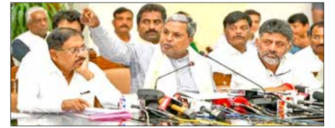
ಲೋಪದೋಷ ಸರಿಪಡಿಸಿ ಜಾರಿಗೊಳಿಸುವ ಅಧಿಕಾರ ಸಿದ್ದರಾಮಯ್ಯ ಹೆಗಲಿಗೆ ಹಿನ್ನೆಲೆಯಲ್ಲಿ ಸಂಪುಟ ಸುಗ್ರೀವಾಜ್ಞೆಗೆ ಅನುಮೋದನೆ ನೀಡಿ ಇರುವ ಸಣ್ಣ-ಪುಟ್ಟ ಲೋಪದೋಷಗಳನ್ನು ಬಗ್ಗಹರಿಸಿ ಜಾರಿಗೆ ತರುವ ಅಧಿಕಾರವನ್ನು ಮುಖ್ಯಮಂತ್ರಿ ಅವರಿಗೆ ನೀಡಿದೆ. ಅವರು, ಹಣಕಾಸು, ಕಾನೂನು, ಕಂದಾಯ, ಗೃಹ (2ನೇ ಪುಟಕ್ಕೆ)

ಬೆಂಗಳೂರು, ಜ.30- ಮೈಕ್ರೋ ಫೈನಾನ್ಸ್ ಕಂಪನಿಗಳ ಮೇಲೆ ಲಗಾಮು ಹಾಕುವ ಸುಗ್ರೀವಾಜ್ಞೆಗೆ ರಾಜ್ಯ ಸಚಿವ ಸಂಪುಟ ಇಂದಿಲ್ಲಿ ಅನುಮೋದನೆ ನೀಡಿದೆ. ಸುಗ್ರೀವಾಜ್ಞೆಯನ್ನು ಯಾವ ರೀತಿ ಜಾರಿಗೊಳಿಸಬೇಕೆಂಬ ಅಧಿಕಾರವನ್ನು ಮುಖ್ಯಮಂತ್ರಿ ಸಿದ್ದರಾಮಯ್ಯ ಅವರಿಗೆ ನೀಡಲಾಗಿದೆ. ಸಂಪುಟ ಸಭೆ ನಂತರ ಸುದ್ದಿಗೋಷ್ಠಿಯಲ್ಲಿ ಈ ವಿಷಯ ತಿಳಿಸಿದ ಕಾನೂನು ಮತ್ತು ಸಂಸದೀಯ ವ್ಯವಹಾರಗಳ ಖಾತೆ ಸಚಿವ ಎಚ್.ಕೆ.ಪಾಟೀಲ್, ಸುಗ್ರೀವಾಜ್ಞೆಯಲ್ಲಿ ಸಾಲಗಾರರ ಹಿತ ಕಾಪಾಡುವ ಅಂಶಗಳನ್ನು ಅಳವಡಿಸಲಾಗಿದೆ. ಆದರೆ, ಇದರಲ್ಲಿ ಸಣ್ಣ-ಪುಟ್ಟ ಮತ್ತು ಆರ್ಥಿಕ ಇಲಾಖೆ ಸಲಹೆ ಕಂದಾಯ, ಗೃಹ (2ನೇ ಪುಟಕ್ಕೆ)