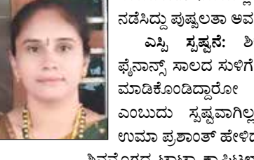
ಶಿವಮೊಗ್ಗದ ಟಾಟಾ ಕ್ಯಾಟಿಟ್ ಫೋನ್ ನಲ್ಲಿ 35 ರಿಂದ 40 ಲಕ್ಷ ರೂ. ಸಾಲ ಪಡೆದಿರುವ ಮಾಹಿತಿ ತಿಳಿದು ಬಂದಿದೆ. ನದಿಗೆ ಹಾರಿದ್ದ ವಿಚಾರಕ್ಕೆ ಸಂಬಂಧಿಸಿದಂತೆ ಯಾವುದೇ ಸ್ಪಷ್ಟತೆ ಇಲ್ಲ. ಈ ಘಟನೆಗೆ ಸಂಬಂಧಿಸಿದಂತೆ ಇನ್ನೂ ಹೊನ್ನಾಳಿ ಪೊಲೀಸ್ ಠಾಣೆಯಲ್ಲಿ ಪ್ರಕರಣ ದಾಖಲಾಗಿಲ್ಲ ಎಂದು ಹೇಳಿದ್ದಾರೆ. ಪೊಲೀಸ್ ಇಲಾಖೆಯಿಂದ ಕೂಡ ಶಿಕ್ಷಕಿ ತುಂಗಭದ್ರಾ ನದಿಗೆ ಹಾರಲು ಕಾರಣವೇನು ಎಂಬ ಕುತಂಭ ಮಾಹಿತಿ ಕಲೆ ಹಾಕುತ್ತಿದ್ದೇವೆ. ದೂರು ದಾಖಲಾದ ಬಳಿಕ, ಮಾಹಿತಿ ಕಲೆ ಹಾಕಿದ ನಂತರ ಶಿಕ್ಷಕಿ ನದಿಗೆ ಹಾರಿದ್ದರ ಕುರಿತಂತೆ ಸ್ಪಷ್ಟ ಮಾಹಿತಿ ಸಿಗಲಿಲ್ಲ ಎಂದು ಉಮಾ ಪ್ರಶಾಂತ್ ತಿಳಿಸಿದ್ದಾರೆ.

ದಾವಣಗೆರೆ, ಜ. 27 - ಹೊನ್ನಾಳಿ ಪಟ್ಟಣದ ದುರ್ಗುಡಿ ನಿವಾಸಿ ಸರ್ಕಾರಿ ಶಾಲೆಯ ಶಿಕ್ಷಕಿಯೊಬ್ಬರು ಭಾನುವಾರ ಮಧ್ಯಾಹ್ನದಿಂದ ಕಾಣೆಯಾಗಿದ್ದು, ಫೋನ್ ಸಂಪನ್ ಸಾಲುಗಾರರ ಕಿರುಕುಳದಿಂದ ಬೇಸತ್ತು ತುಂಗಭದ್ರಾ ನದಿಗೆ ಹಾರಿ ಆತ್ಮಹತ್ಯೆ ಮಾಡಿಕೊಂಡಿರುವುದು ಎಂದು ಕುಟುಂಬದವರು ಶಂಕಿಸಿದ್ದಾರೆ.