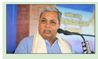
ಅಂತಿಮ ತನಿಖಾ ವರದಿ ಸಲ್ಲಿಸಲು ಲೋಕಾಯುಕ್ತರ ಗಡುವು ವಿಸ್ತರಣೆ

ಬೆಂಗಳೂರು, ಜ.27 - ಮೈಸೂರು ನಗರಾಭಿವೃದ್ಧಿ ಪ್ರಾಧಿಕಾರದಿಂದ ಮುಖ್ಯಮಂತ್ರಿ ಸಿದ್ದರಾಮಯ್ಯ ಕುಟುಂಬ ಬಡ ನಿವೇಶನಗಳ ಹಂಚಿಕೆ ಪ್ರಕರಣವನ್ನು ಸಿಬಿಐ ತನಿಖೆಗೆ ವಹಿಸುವಂತೆ ಕೋರಿ ಸಲ್ಲಿಸಲಾಗಿದ್ದ ಅರ್ಜಿ ವಿಚಾರಣೆ ಪೂರ್ಣಗೊಳಿಸಿದ ನ್ಯಾಯಾಲಯ ತೀರ್ಪನ್ನು ಕಾಯ್ದಿರಿಸಿದೆ.