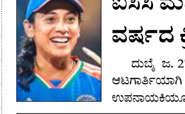
ಐಸಿಸಿ ಮಹಿಳಾ ಏಕದಿನ 2024 ವರ್ಷದ ಕ್ರಿಕೆಟ್ ಆಗಿ ಸ್ಮೃತಿ ಮಂದಾನಾ

ಶಿವಮೊಗ್ಗದ ಟಾಟಾ ಕ್ಯಾಟಿಟ್ ಫೋನ್ ನಲ್ಲಿ 35 ರಿಂದ 40 ಲಕ್ಷ ರೂ. ಸಾಲ ಪಡೆದಿರುವ ಮಾಹಿತಿ ತಿಳಿದು ಬಂದಿದೆ. ನದಿಗೆ ಹಾರಿದ್ದ ವಿಚಾರಕ್ಕೆ ಸಂಬಂಧಿಸಿದಂತೆ ಯಾವುದೇ ಸ್ಪಷ್ಟತೆ ಇಲ್ಲ. ಈ ಘಟನೆಗೆ ಸಂಬಂಧಿಸಿದಂತೆ ಇನ್ನೂ ಹೊನ್ನಾಳಿ ಪೊಲೀಸ್ ಠಾಣೆಯಲ್ಲಿ ಪ್ರಕರಣ ದಾಖಲಾಗಿಲ್ಲ ಎಂದು ಹೇಳಿದ್ದಾರೆ. ಪೊಲೀಸ್ ಇಲಾಖೆಯಿಂದ ಕೂಡ ಶಿಕ್ಷಕಿ ತುಂಗಭದ್ರಾ ನದಿಗೆ ಹಾರಲು ಕಾರಣವೇನು ಎಂಬ ಕುತಂಭ ಮಾಹಿತಿ ಕಲೆ ಹಾಕುತ್ತಿದ್ದೇವೆ. ದೂರು ದಾಖಲಾದ ಬಳಿಕ, ಮಾಹಿತಿ ಕಲೆ ಹಾಕಿದ ನಂತರ ಶಿಕ್ಷಕಿ ನದಿಗೆ ಹಾರಿದ್ದರ ಕುರಿತಂತೆ ಸ್ಪಷ್ಟ ಮಾಹಿತಿ ಸಿಗಲಿಲ್ಲ ಎಂದು ಉಮಾ ಪ್ರಶಾಂತ್ ತಿಳಿಸಿದ್ದಾರೆ.