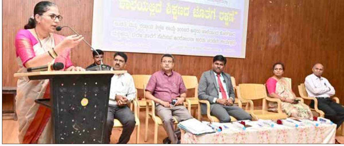
ದಾವಣಗೆರೆ ಅಧಿಕಾರಿಗಳ ಸಭೆಯಲ್ಲಿ ವಿವಿಧ ವಿಷಯಗಳ ಕುರಿತು ಸಭೆಯಲ್ಲಿ ಅಧಿಕಾರಿಗಳಿಗೆ ಮಾಹಿತಿ ನೀಡಲಾಯಿತು.