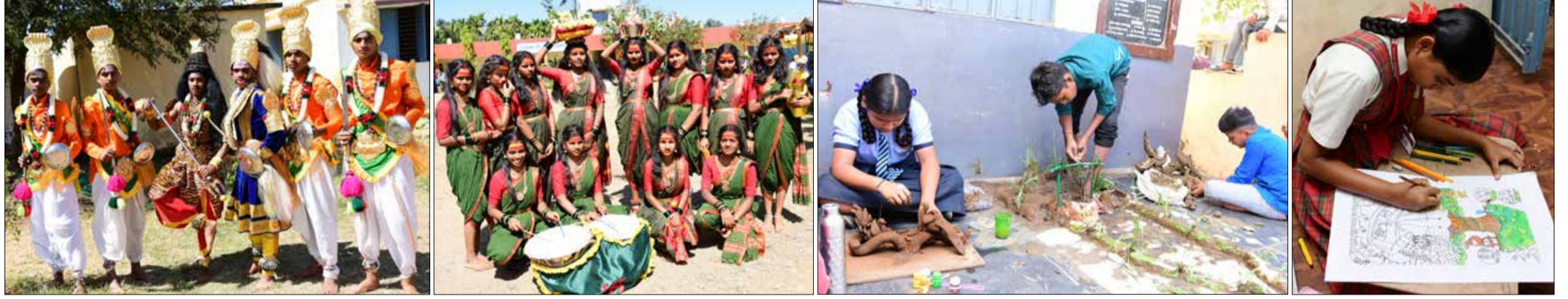
ದಾವಣಗೆರೆಗೆ ಸಮೀಪದ ಬಸವನೂರು ಸರ್ಕಾರಿ ಪ್ರೌಢಶಾಲೆಯ ಆವರಣದಲ್ಲಿ ಬುಧವಾರ ನಡೆದ ಜಿಲ್ಲಾ ಮಟ್ಟದ ಪ್ರತಿಭಾ ಕಾರಂಜಿಯಲ್ಲಿ ಸಾಮೂಹಿಕ ಹಾಗೂ ವೈಯಕ್ತಿಕ ಸ್ಪರ್ಧೆಯಲ್ಲಿ ಪಾಲ್ಗೊಂಡಿದ್ದ ವಿದ್ಯಾರ್ಥಿಗಳು.

ಸಂಪುಟ : 51 ಸಂಚಿಕೆ : 251 ☎ 08192-254736 📍 91642 99999 RNI No: 27369 ಪುಟ : 6 ರೂ : 5.00 🌐 www.janathavani.com ✉ janathavani@mac.com