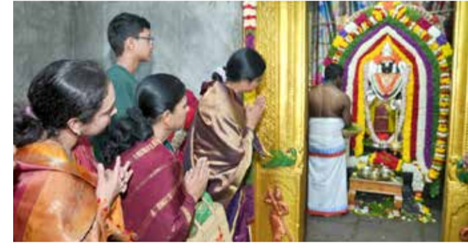
ಸದಸ್ಯರೊಂದಿಗೆ ಭೇಟಿ ನೀಡಿ ಶ್ರೀ ವೆಂಕಟೇಶ್ವರ ಸ್ವಾಮಿಯ ದರ್ಶನ ಪಡೆದರು. ಈ ವೇಳೆ ದೇವಸ್ಥಾನದ ಆಡಳಿತ ಮಂಡಳಿಯವರು ಸಂಸದರನ್ನು ಸನ್ಮಾನಿಸಿ ಗೌರವಿಸಿದರು. ಬಳಿಕ ಸಂಸದರು ನಗರದೇವತೆ ಶ್ರೀ ದುರ್ಗಾಂಬಿಕಾ ದೇವಿ ದೇವಾಲಯಕ್ಕೂ ತೆರಳಿ

ದಾವಣಗೆರೆ, ಜಿ. 11 - ವೈಕುಂಠ ಏಕಾದಶಿ ಹಿನ್ನೆಲೆಯಲ್ಲಿ ಲೋಕಸಭಾ ಸದಸ್ಯರಾದ ಡಾ.ಪ್ರಭಾ ಮಲ್ಲಿಕಾರ್ಜುನ್ ಅವರು ನಗರದ ಎಂಪಿಎಸ್ 'ಬಿ' ಬ್ಲಾಕ್ ನಲ್ಲಿರುವ ಶ್ರೀ ಲಕ್ಷ್ಮೀ ವೆಂಕಟೇಶ್ವರ ದೇವಸ್ಥಾನಕ್ಕೆ ಕುಟುಂಬ