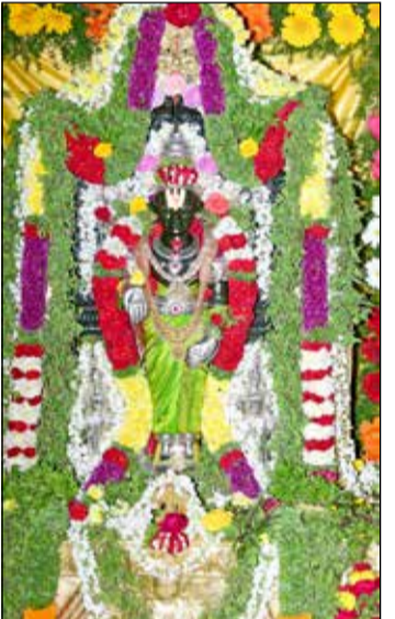
ದಾವಣಗೆರೆ ನಗರದ ಬೇತೂರು ರಸ್ತೆಯ ಲಕ್ಷ್ಮೀ ವೆಂಕಟೇಶ್ವರ ದೇವಾಲಯದಲ್ಲೂ ವೈಕುಂಠ ಏಕಾದಶಿ ನಡೆದಿದ್ದು, ಭಕ್ತರು ಸಹಸ್ರಾರು ಸಂಖ್ಯೆಯಲ್ಲಿ ಆಗಮಿಸಿ, ದರ್ಶನ ಪಡೆದರು.