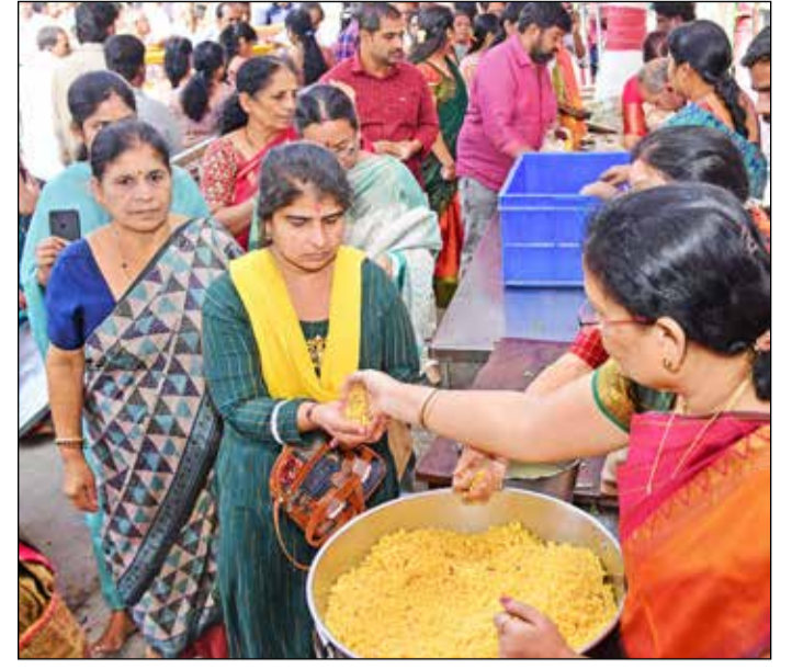
ದೇವಸ್ಥಾನದ ಮುಂಭಾಗ ಪ್ರಸಾದ ವಿತರಿಸಲಾಯಿತು.