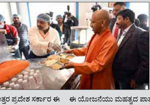
ಯೋಜನೆ ಘೋಷಿಸಿದೆ. ಪ್ರಯಾಗ್‌ರಾಜ್‌ಗೆ ಭೇಟಿ ನೀಡಿದ ಸಿಎಂ ಯೋಗಿ ಅದಿತ್ಯನಾಥ್ ಅವರು ಆಸ್ಪತ್ರೆಯ ಸೌಲಭ್ಯಗಳನ್ನು ಪರಿಶೀಲಿಸಿದರು ಮತ್ತು ಉಪಕ್ರಮದ ಉದ್ಘಾಟನೆಯ ಸಂದರ್ಭದಲ್ಲಿ ಹಾಜರಿದ್ದವರಿಗೆ ಪೈಯುಕ್ತಿಕವಾಗಿ ಆಹಾರವನ್ನು ನೀಡಿದರು. ಮಹಾಕುಂಭ ಮೇಳದ ಸಮಯದಲ್ಲಿ ಭಕ್ತರು, ನಿವಾಸಿಗಳಿಗೆ ಕೈಗೆಟುಕುವ ಮತ್ತು ಪೌಷ್ಟಿಕಾಂಶದ ಊಟವನ್ನು ಖಾತ್ರಿಪಡಿಸುವಲ್ಲಿ ಈ ಯೋಜನೆಯು ಮಹತ್ವದ ಪಾತ್ರವನ್ನು ವಹಿಸುತ್ತದೆ ಎಂದು ನಿರೀಕ್ಷಿಸಲಾಗಿದೆ.

ಪ್ರಯಾಗ್‌ರಾಜ್, ಜಿ.10- ಮಹಾ ಕುಂಭ ಮೇಳಕ್ಕೆ ಬರುವವರಿಗೆ ಕೇವಲ 9 ರೂ.ಗೆ ಫುಲ್ ಊಟ ನೀಡುವ 'ಮಾ ಕಿ ರಸೋಯಿ' ಎಂಬ ಸಮುದಾಯ ಅಡುಗೆ ಮನೆ ಯನ್ನು ಶುಕ್ರವಾರ ಉತ್ತರ ಪ್ರದೇಶ ಮುಖ್ಯಮಂತ್ರಿ ಯೋಗಿ ಅದಿತ್ಯನಾಥ್ ಅವರು ಉದ್ಘಾಟಿಸಿದರು. ಈ ಸಮುದಾಯ ಅಡುಗೆ ಮನೆಯನ್ನು ಸ್ವರೂಪ್ ರಾಣಿ ನೆಹರು ಆಸ್ಪತ್ರೆಯಲ್ಲಿ ನಂದಿ ಸೇವಾ ಸಂಸ್ಥಾನ ನಿರ್ವಹಿಸುತ್ತದೆ ಮತ್ತು ಆರ್ಥಿಕವಾಗಿ ದುರ್ಬಲ ವರ್ಗದ ಜನರನ್ನು ಬೆಂಬಲಿಸಲು ಉತ್ತರ ಪ್ರದೇಶ ಸರ್ಕಾರ ಈ