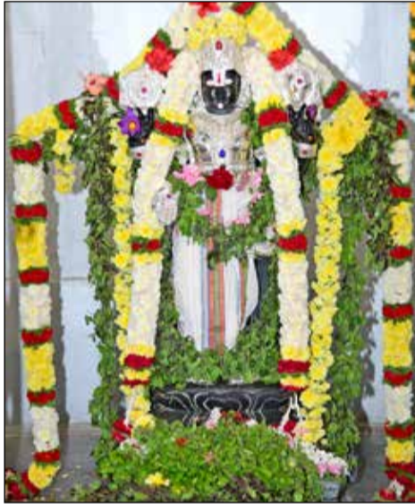
ಕುಂದುವಾಡ ಕೆರೆ ಪಕ್ಕದ ಬಾಲಾಜಿ ನಗರದಲ್ಲಿನ ಶ್ರೀ ವೆಂಕಟೇಶ್ವರ ಸ್ವಾಮಿ ದೇವಸ್ಥಾನದಲ್ಲಿ ವೈಕುಂಠ ಏಕಾದಶಿ ಆಂಗವಾಗಿ ವಿಶೇಷ ಅಲಂಕಾರ ಮಾಡಲಾಗಿತ್ತು.

ದೇವಸ್ಥಾನಕ್ಕೆ ಆಗಮಿಸಿ ನಾರಾಯಣಸ್ವಾಮಿಯ ದರ್ಶನ ಪಡೆದರು. ಸಂಜೆ ಗ್ರಾಮದಲ್ಲಿ ಶ್ರೀದೇವಿ ಭೂ ದೇವಿ ಹಾಗೂ ಶ್ರೀಮನ್ನಾರಾಯಣ ಸ್ವಾಮಿಯ ಪಲ್ಲಕ್ಕಿ ಉತ್ಸವವು ವ್ಯೂಹವೇಷೆಯಿಂದ ಜರುಗಿತು. ಮಂಗಳೂರಿನ ಜಾಡೀಮೇಳ ಸೇರಿದಂತೆ ವಿವಿಧ ಕಲಾ ಮೇಳಗಳು ಉತ್ಸವಕ್ಕೆ ಮೆರಗು ತಂದವು.