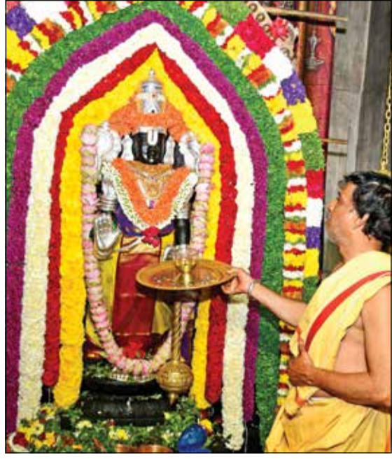
ದಾವಣಗೆರೆ ಎಂ.ಎಸ್. 'ಬಿ' ಬ್ಲಾಕ್‌ನ ಶ್ರೀಲಕ್ಷ್ಮೀ ವೆಂಕಟೇಶ್ವರ ಸ್ವಾಮಿ ದೇವಸ್ಥಾನದಲ್ಲಿ ವೈಕುಂಠ ಏಕಾದಶಿ ಪ್ರಯುಕ್ತ ಸ್ವಾಮಿಗಿ ವಿಶೇಷ ಆಲಂಕಾರ

ಸಂಪುಟ : 51 ಸಂಚಿಕೆ : 239 ☎ 08192-254736 📞 91642 99999 RNI No: 27369 ಪುಟ : 6 ರೂ : 5.00 🌐 www.janathavani.com ✉ janathavani@mac.com