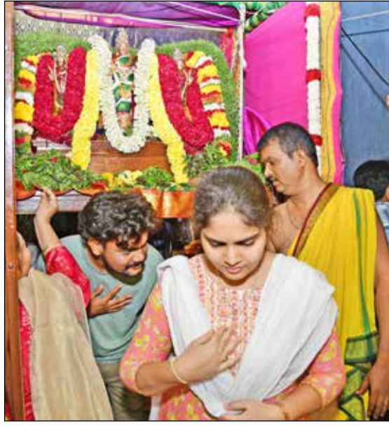
ಉತ್ತರ ದ್ವಾರದ ಮೂಲಕ ಆಗಮಿಸುತ್ತಿರುವ ಭಕ್ತರು