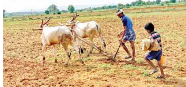
ಬೆಳ್ಳಾನೆ ಎರಡತ್ತು ಬೆಳ್ಳಿಯ ಬಾರಕೋಲು...ಮುಂಗಾರು ಪೂರ್ವ ಮಳೆ ಉತ್ತಮವಾಗಿದ್ದ ಪರಿಣಾಮ ಗರಿಗರಿದ ಕೃಷಿ ಚಟುವಟಿಕೆಗಳು.