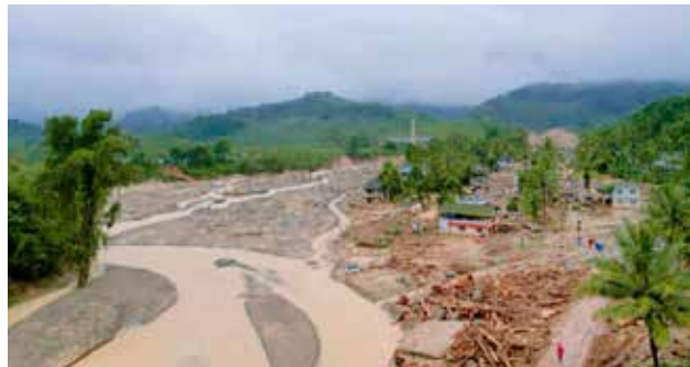
ಕೇರಳದ ವಯನಾಡಿನ ಪ್ರಕೃತಿಯ ರುದ್ರ ನರ್ತನ...