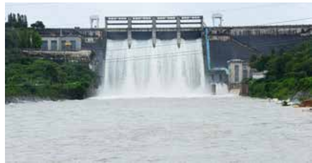
ಪ್ರಸಕ್ತ ವರ್ಷ ಅತಿ ವೇಗವಾಗಿ ಭರ್ತಿಯಾಗಿರುವ ಭದ್ರಾ ಜಲಾಶಯದಿಂದ ನೀರನ್ನು ಹೊರ ಬಿಡುಗಡೆ ಮಾಡುವ ದೃಶ್ಯ...