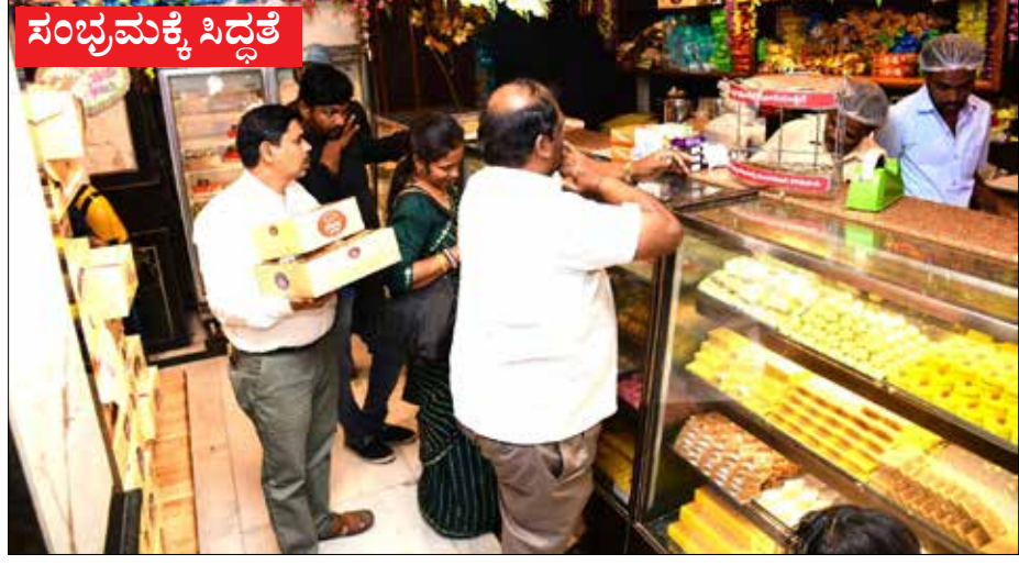
2025ರ ಹೊಸ ಕ್ಯಾಲೆಂಡರ್ ವರ್ಷವನ್ನು ದಾವಣಗೆರೆ ನಗರದಲ್ಲಿ ಸಂಭ್ರಮದಿಂದ ಸ್ವಾಗತಿಸಲಾಯಿತು. ಕೆಆರ್ ಕತ್ತರಿಯ ಸಂಭ್ರಮಸಲು ಮಂಗಳವಾರ ಸಂಜೆಯಿಂದಲೇ ಬೇಕೆಗಳಲ್ಲಿ ಕೆಆರ್‌ಗಳಿಗೆ ಭಾರೀ ಬೇಡಿಕೆ ಉಂಟಾಗಿತ್ತು.

ಸಂಪುಟ : 51 ಸಂಚಿಕೆ : 229 ☎ 08192-254736 📠 91642 99999 RNI No: 27369 ಪುಟ : 6 ರೂ : 5.00 🌐 www.janathavani.com ✉ janathavani@mac.com