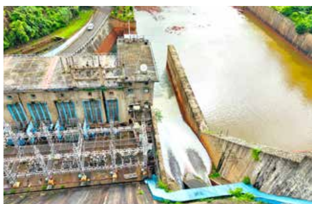
ಆತಂಕ ಮೂಡಿಸಿದ್ದ ಭದ್ರಾ ಡ್ಯಾಂ ಗೇಟ್ ದುರಸ್ತಿ ಪೂರ್ಣ...