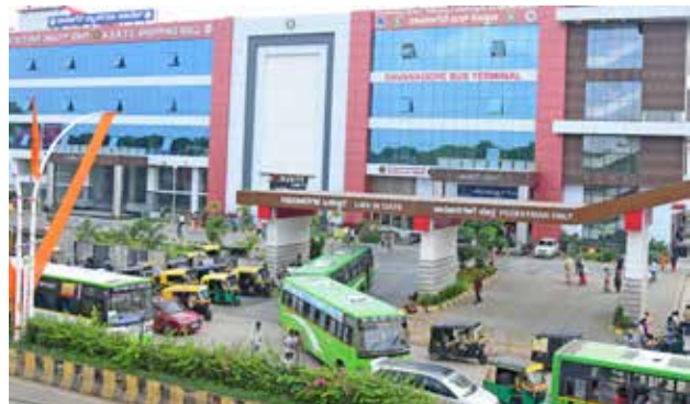
ವಾಹಾ..! ಇದು ಸ್ಕಾರ್ಟ್ ಬಸ್ ನಿಲ್ದಾಣ : ಖಾಸಗಿ ಬಸ್ ನಿಲ್ದಾಣದ ತೆಗೆತೆಗೆ ಬೆನ್ನಲ್ಲೇ, ಕೆಎಸ್ಆರ್‌ಟಿಸಿ ಬಸ್ ನಿಲ್ದಾಣಕ್ಕೆ ಮೆಟ್ಟುಗ.