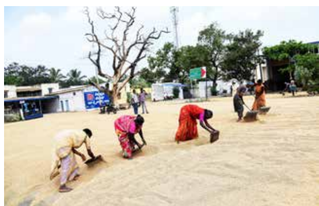
ಎಪಿಎಂಸಿಗೆ ಜೀವಕಳೆ...! ಸುಗ್ಗಿಯ ಕಾಲ ಆರಂಭವಾಗಿದ್ದು, ದಿನೇ ದಿನೇ ಮಾರುಕಟ್ಟೆಗೆ ಹೆಚ್ಚಾಗುತ್ತಿರುವ ಆವಕ.