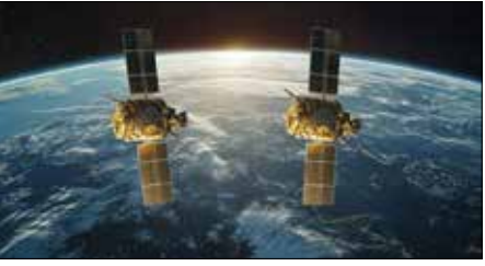
ಪಿಎಸ್‌ಎಲ್‌ವಿ-ಸಿ60 ರಾಕೆಟ್ 220ಕೆ.ಜಿ ತೂಕದ ಎರಡು ಸ್ಪೇಡೆಕ್ಸ್ ಉಪಗ್ರಹ ಮತ್ತು 24 ಪೆಲೋಡ್‌ಗಳನ್ನು ಹೊಂದಿರುವ ಪಿಎಫ್‌ಎಂ-4 ಅನ್ನು ನಿಗದಿತ ಕಕ್ಷೆಗೆ ಸೇರಿಸಿದ ಎಂದವರು ತಿಳಿಸಿದ್ದಾರೆ.

ಶ್ರೀಹರಿಕೋಟೆ, ಡಿ.31- 'ಸ್ಪೇಡೆಕ್ಸ್-ಎ' ಹಾಗೂ 'ಸ್ಪೇಡೆಕ್ಸ್-ಬಿ' ಎಂಬ ಎರಡು ಉಪಗ್ರಹಗಳ ಉದಾವಣೆಯಲ್ಲಿ ಭಾರತೀಯ ಬಾಹ್ಯಾಕಾಶ ಸಂಸ್ಥೆ ಇಸ್ರೋ ಯಶಸ್ವಿಯಾಗಿದೆ. ಪಿಎಸ್‌ಎಲ್‌ವಿ-ಸಿ60 ರಾಕೆಟ್ ಮೂಲಕ ಉಪಗ್ರಹಗಳನ್ನು ನಿಗದಿತ ಕಕ್ಷೆಗೆ ಸೇರಿಸಲಾಗಿದೆ ಎಂದು ಭಾರತೀಯ ಬಾಹ್ಯಾಕಾಶ ಸಂಸ್ಥೆ (ಇಸ್ರೋ) ಘೋಷಿಸಿದೆ.