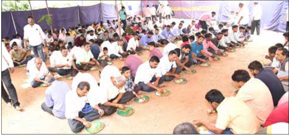
ಕಾಯಿಪೇಟೆ ಬಸವೇಶ್ವರ ದೇವಸ್ಥಾನ ಸೇವಾ ಸಂಘದಿಂದ ಮಹೇಶ್ವರ ಜಾತ್ರೆ

ದಾವಣಗೆರೆ ಕಾಯಿಪೇಟೆಯ ಶ್ರೀ ಬಸವೇಶ್ವರ ದೇವಸ್ಥಾನ ಸೇವಾ ಸಂಘದ ವತಿಯಿಂದ ಬುಧವಾರ ಪೂಜಾ ಇಂಟರ್ ನ್ಯಾಷನಲ್ ಹೋಟೆಲ್ ಪಕ್ಕದಲ್ಲಿರುವ ಶ್ರೀ ಮಹೇಶ್ವರ ಸ್ವಾಮಿ ನಿವೇಶನದಲ್ಲಿ ಶ್ರೀ ಮಹೇಶ್ವರ ಸ್ವಾಮಿ ಜಾತ್ರೆ ವಿಜೃಂಭಣೆಯಿಂದ ನಡೆಯಿತು. ಎರಡನೇ ದಿನವಾದ ಬುಧವಾರ ಭಕ್ತರು ಅನ್ನ, ಸಾರು ಪ್ರಸಾದ ಸೇವಿಸಿದರು.