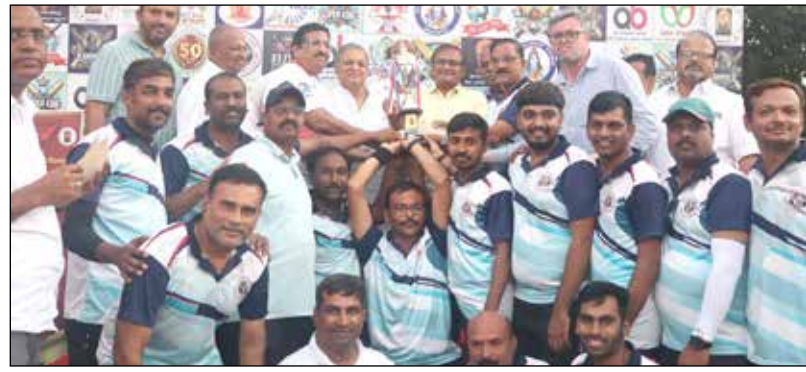
ತೃತೀಯ ಸ್ಥಾನ ಪಡೆದ ಬಾಪೂಜಿ ಸಹಕಾರಿ ಬ್ಯಾಂಕ್

ದಾವಣಗೆರೆ, ಡಿ. 22- ಇಂದಿಲ್ಲಿ ಮುಕ್ತಾಯಗೊಂಡ ಸ್ಥಳೀಯ ಸಹಕಾರ ಬ್ಯಾಂಕುಗಳ, ಉದ್ಯೋಗಿಗಳ ಸಹಕಾರ ಖೀಮಿಯರ್ ಲೀಗ್ ಕ್ರಿಕೆಟ್ ಪಂದ್ಯಾವಳಿಯಲ್ಲಿ ದಾವಣಗೆರೆ ಅರ್ಬನ್ ಕೋ-ಆಪರೇಟಿವ್ ತಂಡ ಪ್ರಥಮ ಸ್ಥಾನವನ್ನು ತನ್ನದಾಗಿಸಿಕೊಳ್ಳುವಲ್ಲಿ ಯಶಸ್ವಿಯಾಗಿದೆ. ಪಂದ್ಯಾವಳಿಯ ಆಯೋಜಕರಾಗಿದ್ದ ದಾವಣಗೆರೆ - ಹರಿಹರ ಅರ್ಬನ್ ಸಹಕಾರ ಬ್ಯಾಂಕಿನ ತಂಡವು ದ್ವಿತೀಯ ಸ್ಥಾನ ಗಳಿಸಿದರೆ, ಬಾಪೂಜಿ ಸಹಕಾರ ಬ್ಯಾಂಕಿನ ತಂಡ ತೃತೀಯ ಸ್ಥಾನವನ್ನು ಪಡೆದುಕೊಳ್ಳುವಲ್ಲಿ ತೃಪ್ತಿಪಟ್ಟುಕೊಂಡಿತು. ದಾವಣಗೆರೆ ಅರ್ಬನ್ ಬ್ಯಾಂಕ್, ಶ್ರೀ ಕನ್ನಕಾ ಪರಮೇಶ್ವರಿ ಬ್ಯಾಂಕ್, ದಾವಣಗೆರೆ-ಹರಿಹರ ಅರ್ಬನ್ ಬ್ಯಾಂಕ್ ಮತ್ತು ಬಾಪೂಜಿ ಬ್ಯಾಂಕುಗಳ ತಂಡಗಳು ಸೆಮಿಫೈನಲ್ ತಲುಪಿದಾಗ ದಾವಣಗೆರೆ - ಹರಿಹರ ಅರ್ಬನ್