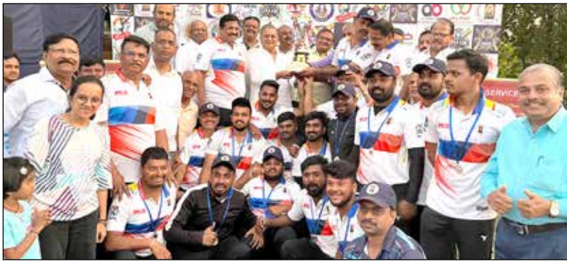
ದ್ವಿತೀಯ ಸ್ಥಾನ ಪಡೆದ ದಾವಣಗೆರೆ - ಹರಿಹರ ಅರ್ಬನ್ ಸಹಕಾರ ಬ್ಯಾಂಕ್