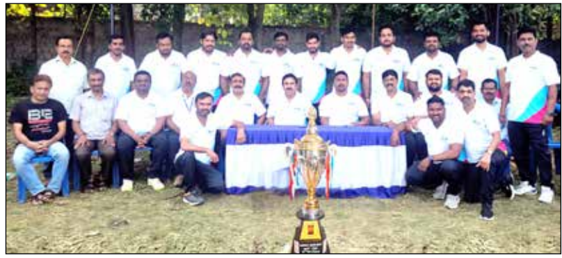
ಪ್ರಥಮ ಸ್ಥಾನ ಪಡೆದ ದಾವಣಗೆರೆ ಅರ್ಬನ್ ಕೋ ಆಪರೇಟಿವ್ ಬ್ಯಾಂಕ್

ದಾವಣಗೆರೆ ಅರ್ಬನ್ ಬ್ಯಾಂಕ್ ಪ್ರಥಮ, ದಾವಣಗೆರೆ - ಹರಿಹರ ಅರ್ಬನ್ ಸಹಕಾರ ಬ್ಯಾಂಕ್ ದ್ವಿತೀಯ, ಬಾಪೂಜಿ ಸಹಕಾರಿ ಬ್ಯಾಂಕ್ ತೃತೀಯ