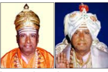
'ರಂಭಾಪುರಿ ಬೆಳಗು' ವಿಶೇಷಾಂಕವನ್ನು ಇಂಧನ ಸಚಿವ ಕೆ.ಬಿ. ಬಾಚ್ಚ್ ಬಿಡುಗಡೆಗೊಳಿಸುವರು.

ಶ್ರೀ ರಂಭಾಪುರಿ ಪೀಠ (ಬಾಳೆಹೊನ್ನೂರು)- ಡಿ. 9 - ಶ್ರೀ ಜಗದ್ಗುರು ರಂಭಾಪುರಿ ವೀರ ಸಿಂಹಾಸನ ಮಹಾಸಂಸ್ಥಾನ ಪೀಠದ 120ನೇ ಜಗದ್ಗುರುಗಳಾಗಿ ಶ್ರೀ ಪೀಠವನ್ನು ಅಲಂಕರಿಸಿದ್ದ ಲಿಂ. ಶ್ರೀಮದ್ ರಂಭಾಪುರಿ ಜಗದ್ಗುರು ಪ್ರಸನ್ನ ರೇಣುಕ ವೀರರುದ್ರಮುನಿ ದೇವ ಶಿವಾಚಾರ್ಯ ಭಗವತ್ಪಾದರ ಜನ್ಮ ಶತಮಾನೋತ್ಸವವನ್ನು ಇದೇ ದಿನಾಂಕ 15 ಭಾನುವಾರ ಬೆಳಿಗ್ಗೆ 11 ಗಂಟೆಗೆ ಆಚರಿಸಲಾಗುವುದು.