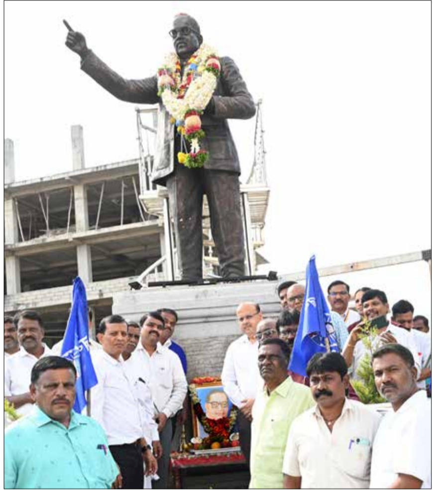
ದಾವಣಗೆರೆ ಅಂಬೇಡ್ಕರ್ ವೃತ್ತದಲ್ಲಿನ ಡಾ.ಬಿ.ಆರ್.ಅಂಬೇಡ್ಕರ್ ರವರ ಪ್ರತಿಮೆಗೆ ಜಿಲ್ಲಾಧಿಕಾರಿಗಳು ಮಾಲಾರ್ಪಣೆ ಮಾಡಿದರು. ಅಧಿಕಾರಿಗಳು, ವಿವಿಧ ಸಂಘಟನೆಗಳ ಮುಖಂಡರು ಈ ಸಂದರ್ಭದಲ್ಲಿದ್ದರು.