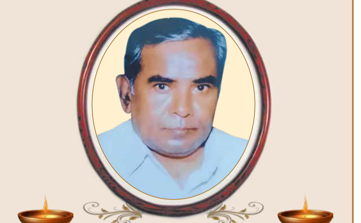
ದಾವಣಗೆರೆ ಸಿಟಿ ವಾಸಿ