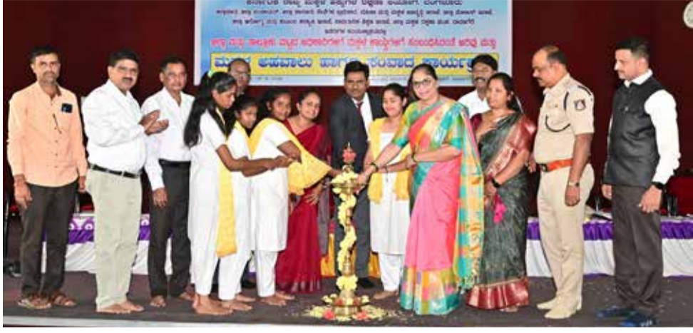
ರಕ್ಷಣಾ ಆಯೋಗದ ಜವಾಬ್ದಾರಿ ಮತ್ತು ಮಕ್ಕಳ ಕಲ್ಯಾಣ ಭಾಗವಹಿಸಿದರು.

ಮಕ್ಕಳು ನಿರ್ಭಯವಾಗಿ ಪೋಕ್ಸೋ ಕಾಯ್ದೆ ಬಾಲ್ಯ ವಿವಾಹ ಕಾಯ್ದೆ, ಚಿಪ್ ಕಾಯ್ದೆ ಹಾಗೂ ಕರ್ನಾಟಕ ರಾಜ್ಯ ಮಕ್ಕಳ