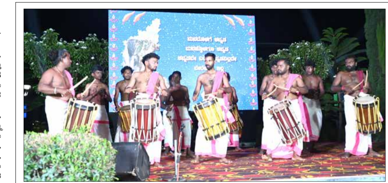
ಚಂಡೆ ಮದ್ದಳೆ.. ಜಿಲ್ಲಾಧಿಕಾರಿ ವತಿಯಿಂದ 69ನೇ ಕರ್ನಾಟಕ ರಾಜ್ಯೋತ್ಸವ ಪ್ರಯುಕ್ತ ಇಲ್ಲಿನ ಗಾಜಿನ ಮನೆಯಲ್ಲಿ ವೈವಿಧ್ಯಮಯ ಸಾಂಸ್ಕೃತಿಕ ಕಾರ್ಯಕ್ರಮಗಳ ಅಂಗವಾಗಿ ಭಾನುವಾರ ಸಂಜೆ ಕಲಾವಿದರು ಚಂಡೆ ಮದ್ದಳೆ ನಡೆಸಿಕೊಟ್ಟರು.