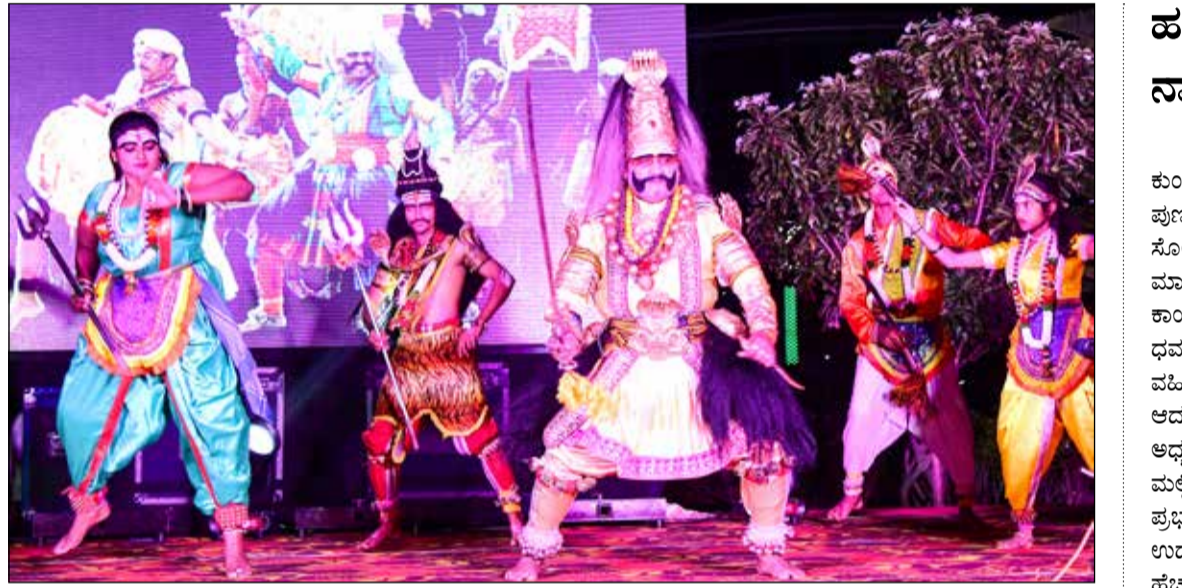
ವೀರಗಾಸೆ... ಜಿಲ್ಲಾಡಳಿತ ವತಿಯಿಂದ 69ನೇ ಕರ್ನಾಟಕ ರಾಜ್ಯೋತ್ಸವ ಪ್ರಯುಕ್ತ ಇಲ್ಲಿನ ಗಾಜಿನ ಮನೆಯಲ್ಲಿ ವೈವಿಧ್ಯಮಯ ಸಾಂಸ್ಕೃತಿಕ ಕಾರ್ಯಕ್ರಮದ ಅಂಗವಾಗಿ ಶನಿವಾರ ಸಂಜೆ ವೀರಗಾಸೆ ಕಾರ್ಯಕ್ರಮ ಜರುಗಿತು.

ಜಿಲ್ಲೆಯಲ್ಲಿ 14.94 ಲಕ್ಷ ಮತದಾರರು ಕರಡು ಮತದಾರರ ಪಟ್ಟಿಯನ್ವಯ 2025 ರ ಜನವರಿಗೆ 1 ಕ್ಕೆ 19,14,379 ಜನಸಂಖ್ಯೆ ನಿರೀಕ್ಷಿಸಲಾಗಿದೆ. ಪ್ರಸ್ತುತ 7,43,476 ಪುರುಷ, 7,51,277 ಮಹಿಳೆ ಸೇರಿ 14,94,753 ಮತದಾರರಿದ್ದಾರೆ. ಇದು ಜನಗಣತಿ ಅಂಕಿ ಅಂಶಕ್ಕೆ ಹೋಲಿಕೆ ಮಾಡಿದಲ್ಲಿ ಶೇ 78.08 ಮತದಾರರಿದ್ದಾರೆ. ವಯೋಮಾನದನ್ವಯ 18 ರಿಂದ 19 ವರ್ಷ 43,805 ಮತದಾರರಿದ್ದು ಜನಸಂಖ್ಯೆಗೆ ಶೇ 2.28%, 20-29 ವರ್ಷದವರೆಗೆ 2,98,110 ಮತದಾರರು ಜನಸಂಖ್ಯೆಗೆ ಶೇ 15.57% ಇದ್ದಾರೆ. 30-39 ವರರೆಗೆ 3,40,012 ಮತದಾರರು ಜನಸಂಖ್ಯೆಗೆ ಶೇ 17.76 ಹಾಗೂ 40-49 ರ (4ನೇ ಪುಟಕ್ಕೆ) ವ್ಯಾಪ್ತಿಯಲ್ಲಿ ಸಂಬಂಧಿಸಿದ ಕಾರ್ಯಾಲಯಗಳಿಗೆ ಹಾಗೂ ಬಿ.ಎಲ್.ಓ.ಗಳಿಗೆ ನೀಡಬಹುದಾಗಿದೆ. ಕಲೆಕ್ಟರ್, 15 ಗ್ರಾಮ ಆಡಳಿತಾಧಿಕಾರಿಗಳು, 16 ದ್ವಿತೀಯ ದರ್ಜೆ ಸಹಾಯಕರು, 14 ಪ್ರಥಮ ದರ್ಜೆ ಸಹಾಯಕರು ಬಿಎಲ್.ಓ.ಗಳಿಗೆ ಕಾರ್ಯನಿರ್ವಹಿಸುತ್ತಿದ್ದಾರೆ ಎಂದರು. ಸಭೆಯಲ್ಲಿ ಜಿಲ್ಲಾ ಪಂಚಾಯತ್ ಮುಖ್ಯ ಕಾರ್ಯನಿರ್ವಾಹಕ ಅಧಿಕಾರಿ ಸುರೇಶ್ ಬಿ. ಇಕ್ಬಾಲ್, ಅಪರ ಜಿಲ್ಲಾಧಿಕಾರಿ ಪಿ.ಎನ್. ರೋಷೇಶ್ ಹಾಗೂ ವಿವಿಧ ರಾಜಕೀಯ ಪಕ್ಷಗಳ ಮುಖಂಡರು ಉಪಸ್ಥಿತರಿದ್ದರು.