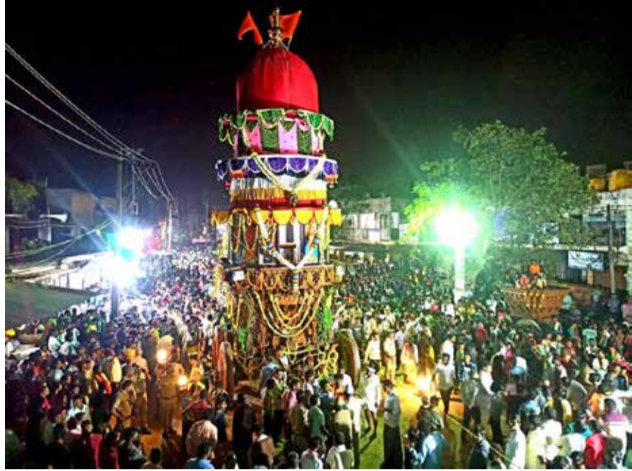
ತೇರು.. ಹರಪನಹಳ್ಳಿ ಪಟ್ಟಣದ ಹೆಚ್‌ಬ್ ನಿಲ್ದಾಣದ ಸುತ್ತಲಿನಲ್ಲಿ ಶ್ರೀವೀರಭದ್ರೇಶ್ವರ ಸ್ವಾಮಿ ರಥೋತ್ಸವ ಶುಕ್ರವಾರ ಸಂಜೆ ಅಪಾರ ಭಕ್ತರ ಮಧ್ಯೆ ಸಂಭ್ರಮದಿಂದ ಜರುಗಿತು.