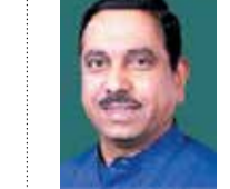
ಹಮ್ಮಿಕೊಂಡಿರುವ ವಿದ್ಯಾರ್ಥಿ ನಿಲಯ ಪ್ರತಿಷ್ಠಾನ ಕಾರ್ಯಕ್ರಮದಲ್ಲಿ ಕೇಂದ್ರ ಸರ್ಕಾರದ ಗ್ರಾಹಕ

ಜಿ.ಎಂ. ವಿಶ್ವವಿದ್ಯಾಲಯದಲ್ಲಿ ಇಂದು ಬೆಳಿಗ್ಗೆ 11 ರಿಂದ ಮಧ್ಯಾಹ್ನ 1 ರವರೆಗೆ