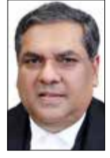
ಯೋಜನೆ, ಇಎಂ-ವಿಪ್ಪಾಟ್ ಟ್ಯಾಲಿ ಇತ್ಯಾದಿಗಳ ಮಹತ್ವದ ತೀರ್ಪುಗಳ ಭಾಗವಾಗಿದ್ದಾರೆ. ಹಾಲಿ ಸಿಜೆಐ ಡಿ.ವೈ. ಚಂದ್ರಚೂಡ್ ಅವರು ಖನ್ನಾ ಅವರನ್ನು ತಮ್ಮ ಉತ್ತರಾಧಿಕಾರಿಯಾಗಿ ಕಳೆದ ತಿಂಗಳು ಶಿಫಾರಸ್ಸು ಮಾಡಿದ ನಂತರ ಅಕ್ಟೋಬರ್ 24 ರಂದು ಕೇಂದ್ರ ಸರ್ಕಾರ ಅವರನ್ನು ಅತ್ಯುನ್ನತ ನ್ಯಾಯಾಂಗ ಕಚೇರಿಗೆ ನೇಮಕ ಮಾಡಿತ್ತು ನವೆಂಬರ್ 11 ರಿಂದ ಜಾರಿಗೆ ಬರುವಂತೆ ಸುಪ್ರೀಂ ಕೋರ್ಟ್‌ನ ಮುಖ್ಯ ನ್ಯಾಯಾಧೀಶರಾಗಿ ನ್ಯಾಯಮೂರ್ತಿ ಸಂಜೀವ್ ಖನ್ನಾ ಅವರನ್ನು ನೇಮಿಸಲು ರಾಷ್ಟ್ರಪತಿಗಳು ಸಂ ತೋ ಷ ಪಟ್ಟಿ ದ್ದಾರೆ (2ನೇ ಪುಟಕ್ಕೆ)

ನವದೆಹಲಿ, ನ.10- ನ್ಯಾಯಮೂರ್ತಿ ಸಂಜೀವ್ ಖನ್ನಾ ಅವರು ಸೋಮವಾರ ಭಾರತದ ಮುಂದಿನ ಮುಖ್ಯ ನ್ಯಾಯಮೂರ್ತಿಯಾಗಿ (ಸಿಜೆಐ) ಪ್ರಮಾಣ ವಚನ ಸ್ವೀಕರಿಸಿದ್ದಾರೆ. ರಾಷ್ಟ್ರಪತಿ ದ್ರೌಪದಿ ಮುರ್ಮು ಅವರು ಖನ್ನಾ ಅವರಿಗೆ ಪ್ರಮಾಣ ವಚನ ಬೋಧಿಸಿದ್ದಾರೆ. ನ್ಯಾಯಮೂರ್ತಿ ಖನ್ನಾ ಅವರು 51 ನೇ ಸಿಜೆಐ ಆಗಿದ್ದು, ಸುಮಾರು 6 ತಿಂಗಳ ಅಧಿಕಾರಾವಧಿ ಹೊಂದಿರುತ್ತಾರೆ. ಸುಪ್ರೀಂ ಕೋರ್ಟ್ ನ್ಯಾಯಾಧೀಶರಾಗಿ, ಅವರು 370 ನೇ ವಿಧಿ ರದ್ದತಿ, ವೃದ್ಧಿಚಾರದ ಅಪರಾಧೀಶರಾಗ, ಚುನಾವಣಾ ಬಾಂಧ್ವಗಳ ಯೋಜನೆ, ಇಎಂ-ವಿಪ್ಪಾಟ್ ಟ್ಯಾಲಿ ಇತ್ಯಾದಿಗಳ ಮಹತ್ವದ ತೀರ್ಪುಗಳ ಭಾಗವಾಗಿದ್ದಾರೆ. ಹಾಲಿ ಸಿಜೆಐ ಡಿ.ವೈ. ಚಂದ್ರಚೂಡ್ ಅವರು ಖನ್ನಾ ಅವರನ್ನು ತಮ್ಮ ಉತ್ತರಾಧಿಕಾರಿಯಾಗಿ ಕಳೆದ ತಿಂಗಳು ಶಿಫಾರಸ್ಸು ಮಾಡಿದ ನಂತರ ಅಕ್ಟೋಬರ್ 24 ರಂದು ಕೇಂದ್ರ ಸರ್ಕಾರ ಅವರನ್ನು ಅತ್ಯುನ್ನತ ನ್ಯಾಯಾಂಗ ಕಚೇರಿಗೆ ನೇಮಕ ಮಾಡಿತ್ತು ನವೆಂಬರ್ 11 ರಿಂದ ಜಾರಿಗೆ ಬರುವಂತೆ ಸುಪ್ರೀಂ ಕೋರ್ಟ್‌ನ ಮುಖ್ಯ ನ್ಯಾಯಾಧೀಶರಾಗಿ ನ್ಯಾಯಮೂರ್ತಿ ಸಂಜೀವ್ ಖನ್ನಾ ಅವರನ್ನು ನೇಮಿಸಲು ರಾಷ್ಟ್ರಪತಿಗಳು ಸಂ ತೋ ಷ ಪಟ್ಟಿ ದ್ದಾರೆ (2ನೇ ಪುಟಕ್ಕೆ)