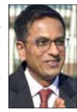
ಅಪರಾಧ ಮುಕ್ತಗೊಳಿಸುವುದು ಸೇರಿದಂತೆ, ಹಲವು ಮಹತ್ವದ ತೀರ್ಪುಗಳಲ್ಲಿ ಅವರು ಭಾಗಿಯಾಗಿದ್ದಾರೆ. ಅಲ್ಲದ ಎಂಟು ವರ್ಷಗಳ ಕಾಲದ ಸುಪ್ರೀಂ ಕೋರ್ಟ್ ನ್ಯಾಯಮೂರ್ತಿ ಅವಧಿಯಲ್ಲಿ ಅವರು 38 ಸಂವಿಧಾನಿಕ ಪೀಠಗಳ ಭಾಗವಾಗಿದ್ದಾರೆ. ಸುಪ್ರೀಂ ಕೋರ್ಟ್‌ನಲ್ಲಿ ತಮ್ಮ ಕಾರ್ಯ ನಿರ್ವಹಣೆ ಅವಧಿಯಲ್ಲಿ ಅವರು 500ಕ್ಕೂ ಹೆಚ್ಚು ತೀರ್ಪುಗಳನ್ನು ನೀಡಿದ್ದಾರೆ. ಇವುಗಳಲ್ಲಿ ಕಾನೂನು ಹಾಗೂ ಸಾಮಾಜಿಕ ವಲಯದಲ್ಲಿ ವ್ಯಾಪಕ ಪರಿಣಾಮ ಬೀರಿವೆ. (2ನೇ ಪುಟಕ್ಕೆ)

ನವದೆಹಲಿ, ನ. 10- ನ್ಯಾಯಮೂರ್ತಿ ಡಿ.ವೈ.ಚಂದ್ರ ಚೂಡ್ ಅವರು ಭಾನುವಾರ ಸುಪ್ರೀಂಕೋರ್ಟ್‌ನ 50ನೇ ಮುಖ್ಯ ನ್ಯಾಯಮೂರ್ತಿಯಾಗಿ ತಮ್ಮ ಕಾರ್ಯನಿರ್ವಹಣೆಯ ಅವಧಿ ಪೂರೈಸಿದ್ದಾರೆ. ತಮ್ಮ 2 ವರ್ಷಗಳ ಅವಧಿಯಲ್ಲಿ ಚಂದ್ರಚೂಡ್ ಸುಪ್ರೀಂ ಕೋರ್ಟ್‌ನಲ್ಲಿ ತಮ್ಮ ಆದೇಶಗಳನ್ನು ಹೊರಡಿಸಿದ್ದಾರೆ ಹಾಗೂ ಗಮನಾರ್ಹ ಸುಧಾರಣೆಗಳನ್ನು ಜಾರಿಗೆ ತಂದಿದ್ದಾರೆ. ಅಯೋಧ್ಯೆ ವಿವಾದ, 370ನೇ ವಿಧಿ ಹಾಗೂ ಸಮತಿಯ ಸಲಿಂಗ ಕಾಮವನ್ನು ಪರಿಣಾಮ ಬೀರಿವೆ. (2ನೇ ಪುಟಕ್ಕೆ)