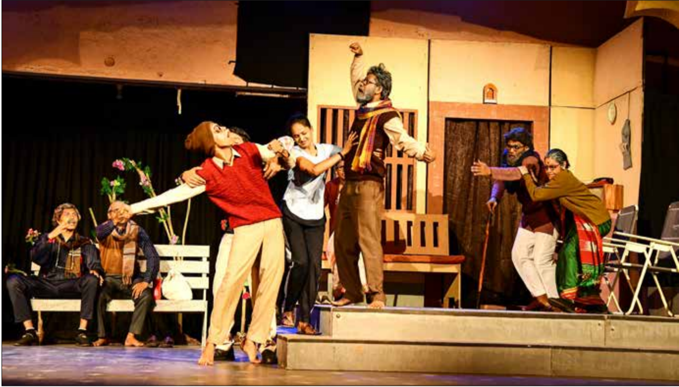
'ಅಂಕದ ಪರದೆ' ಒಡನಾಟ ರಂಗ ತಂಡ, ಸಿದ್ದಗಂಗಾ ವಿದ್ಯಾ ಸಂಸ್ಥೆ ಹಾಗೂ ಇನ್‌ಸ್ಟಿಟ್ಯೂಟ್ ಕೋಚಿಂಗ್ ಇನ್‌ಸ್ಟಿಟ್ಯೂಟ್ ಸಹಯೋಗದೊಂದಿಗೆ ದಾವಣಗೆರೆ ಸಿದ್ದಗಂಗಾ ವಿದ್ಯಾ ಸಂಸ್ಥೆ ಆವರಣದಲ್ಲಿ 'ನೀನಾಸಮ್ ತಿರುಗಾಟ-2024' ಅಂಗವಾಗಿ 'ಅಂಕದ ಪರದೆ' ನಾಟಕ ಪ್ರದರ್ಶನ ನಡೆಯಿತು.