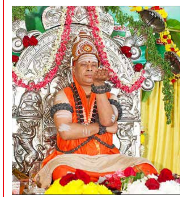
ಶ್ರೀಶೈಲ ಜಗದ್ಗುರುಗಳಿಂದ ಇಷ್ಟಲಿಂಗ ಮಾಪಾಪೋಷಿ ದಾವಣಗೆರೆ ಮಠದಲ್ಲಿ ಸೋಮವಾರ ವಿಷ್ಣು ದೀಪಾವಳಿ ಇಷ್ಟಲಿಂಗ ಮಾಪಾಪೋಷೆಯನ್ನು ಶ್ರೀಶೈಲ ಖಿಲದ ಜಗದ್ಗುರು ಡಾ. ಶ್ರೀ ಚನ್ನಸಿದ್ಧರಾಮ ಪಂಡಿತರಾಜ್ ಶಿವಾಚಾರ್ಯ ಸ್ವಾಮೀಜಿ ನೆರವೇರಿಸಿದರು.

ಗದಗ, ನ. 4 - ಜಿಲ್ಲೆಯ ಗಣೇಂದ್ರಪಟ್ಟಣ ತಾಲ್ಲೂಕಿನ ನರೇಗಲ್‌ನಲ್ಲಿರುವ ಹಾಲಕೇರಿ ಅನ್ನದಾನೇತರ ಮಠ ಪ್ರಸಾದ ನಿಲಯವೂ ವಕ್ಫ್ ಆಸ್ತಿ ಎಂದು ದಾಖಲಾಗಿರುವುದು ಬೆಳಕಿಗೆ ಬಂದಿದೆ. ಪ್ರಸಾದ ನಿಲಯದ 11.19 ಎಕರೆ 2019ರಲ್ಲಿ ವಕ್ಫ್ ಆಸ್ತಿ ಎಂದು ದಾಖಲಾಗಿದೆ. ಸ್ವಾತಂತ್ರ್ಯ ಪ್ರವರ್ಧನಾ ಸ್ವಾತಂತ್ರ್ಯದ ಶ್ರೀ ಅನ್ನದಾನೇತರ ವಿಧ್ಯಾರ್ಪಣೆ ಪ್ರಸಾದ ನಿಲಯ ಸಮಿತಿಯ ಉಚಿತ ಪ್ರಸಾದ ನಿಲಯಕ್ಕೆ ಸೇರಿದ 15.06 ಎಕರೆಯಲ್ಲಿ 11.19 ಎಕರೆ ವಕ್ಫ್ ಆಸ್ತಿ ಎಂದು ನಮೂದು ಆಗಿದೆ. ಉಚಿತ ಪ್ರಸಾದ ನಿಲಯಕ್ಕೆ ಸ್ಥಳೀಯ ರೈತರು, ದಾನಿಗಳ ಸಹಕಾರದಿಂದ ಸಾಕಷ್ಟು ಭೂಮಿಯನ್ನು ಶ್ರೀಮಠಕ್ಕೆ ನೀಡಲಾಗಿತ್ತು.