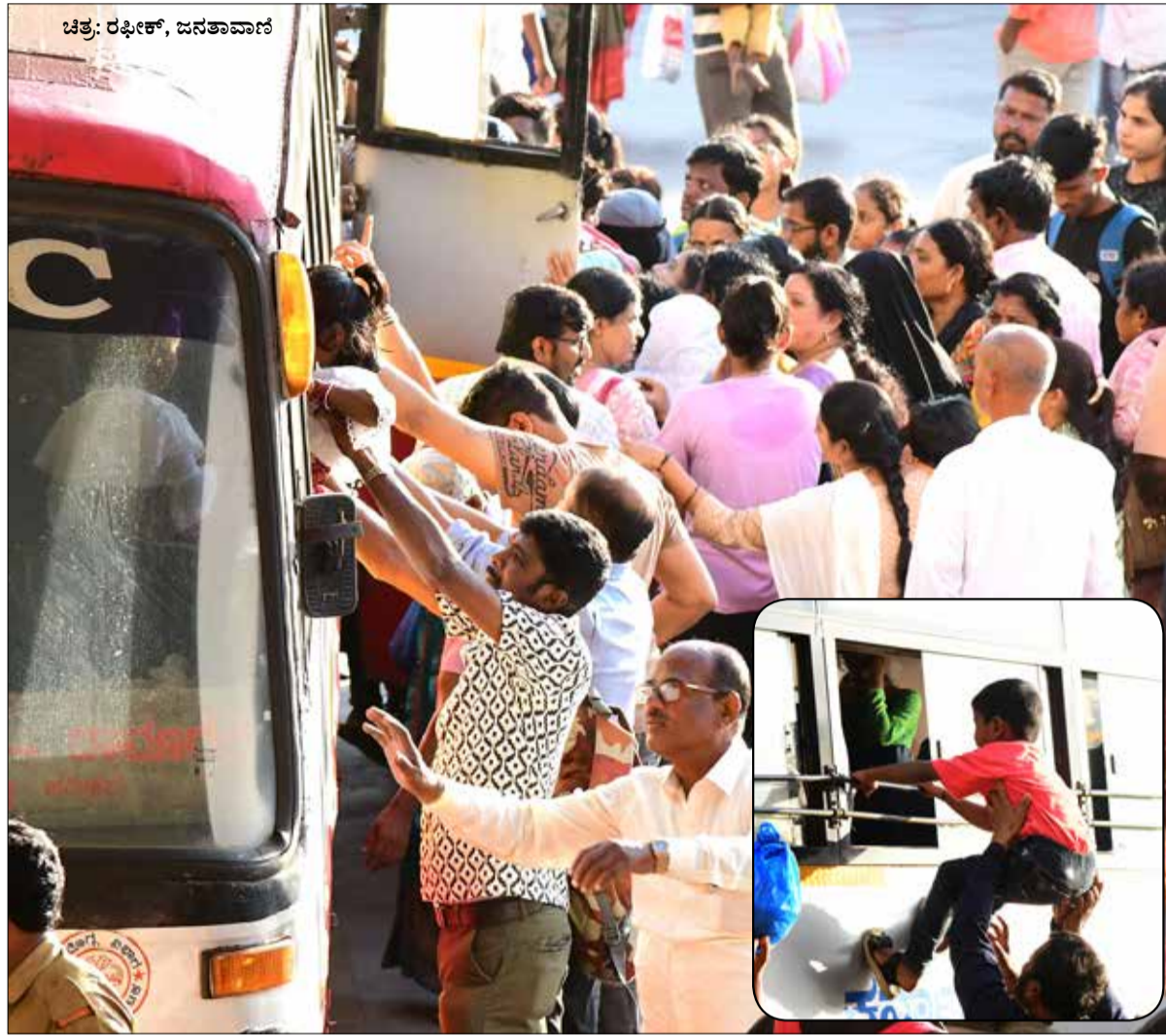
ಚಿತ್ರ: ರಫೀಕ್, ಜನತಾವಾಣಿ ಹಬ್ಬ ಮುಗಿತು... ಸರಣಿ ರಚನೆಗೊಟ್ಟಿಗೆ ಆಗಮಿಸಿದ್ದ ದೀಪಾವಳಿ ಹಬ್ಬದ ಸಂಭ್ರಮದಲ್ಲಿ ಮುಂದೆ ಜನತೆ, ಭಾನುವಾರ ವಾಪಾಸ್ ತಮ್ಮ ತಮ್ಮ ಊರು, ಕೆಲಸ ಮಾಡುವ ಸ್ಥಳಗಳತ್ತ ತೆರಳಿದರು. ಈ ಹಿನ್ನೆಲೆಯಲ್ಲಿ ಕೆಎಸ್‌ಟಿಸಿ ಬಸ್ ನಿಲ್ದಾಣ ಪ್ರಯಾಣಿಕರಂದ ತುಂಬಿತ್ತು. ಬಸ್ ಬರುತ್ತಲೇ ಸೀಟು ಹಿಡಿಯಲು ಪೋಷಕರು ತಮ್ಮ ಮಕ್ಕಳನ್ನು ಕಿಟಕಿ ಮೂಲಕ ಒಳ ನುಗ್ಗಿಸುತ್ತಿದ್ದ ಚಿತ್ರವಿದು.