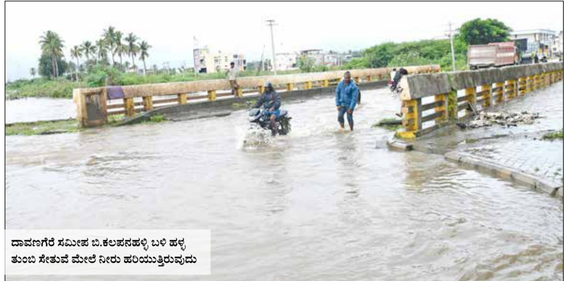
ದಾವಣಗೆರೆ ಸಮೀಪ ಬಿ.ಕಲಪನಹಳ್ಳಿ ಬಳಿ ಹಳ್ಳ ತುಂಬಿ ಸೇತುವೆ ಮೇಲೆ ನೀರು ಹರಿಯುತ್ತಿರುವುದು

ಸಂಪುಟ : 51 ಸಂಚಿಕೆ : 155 ☎ 08192-254736 📞 91642 99999 RNI No: 27369 ಪುಟ : 6 ರೂ : 5.00 🌐 www.janathavani.com ✉ janathavani@mac.com