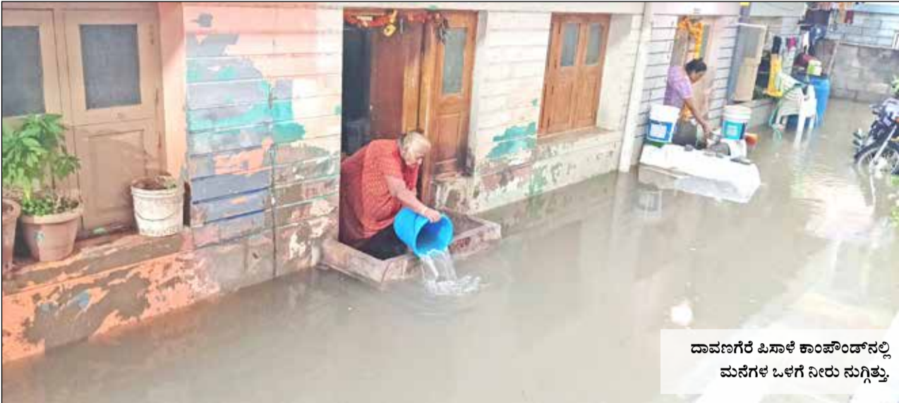
ದಾವಣಗೆರೆ ಓಸಾಳೆ ಕಾಂಪೌಂಡ್‌ನಲ್ಲಿ ಮನೆಗಳ ಬಳಿಗೆ ನೀರು ಸುಗ್ಗಿತ್ತು