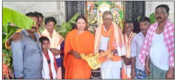
ರಾಣೇಬೆನ್ನೂರು, ಅ.13- ಮಾನವ ಜನ್ಮ ಪಾವನವಾಗಬೇಕಾದ ಪುರಾಣ, ರಾಣೇಬೆನ್ನೂರು ಪ್ರವಚನಗಳನ್ನು ದೇವತೆಗಳ ಚಿತ್ರಗಳನ್ನು ಆಲಿಸಿ ಪಠಿಸಬೇಕೆಂದು ಮಾತೆ ಅನ್ನಪೂರ್ಣೇಶ್ವರಿ ಹಲಗೆರೆ ಹೇಳಿದರು.

ತಾಲ್ಲೂಕಿನ ಹಿರೇಬಿದರಿ ಗ್ರಾಮದೇವತೆ ದೇವಸ್ಥಾನದಲ್ಲಿ ವಿಜಯದಶಮಿ ನಿಮಿತ್ತ ನಡೆದ 9 ದಿನಗಳ ಕಾಲ ಅವರು ದೇವಿಯ ಪುರಾಣ, ಪ್ರವಚನ ಕಾರ್ಯಕ್ರಮ ನಡೆಸಿಕೊಟ್ಟು, ಅಶೀರ್ವಚನ ನೀಡಿದರು.