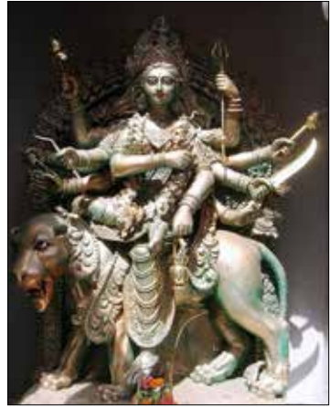
"ಓಂದಯಾ ಪ್ರವರಾರಾಧಾ ಚಂದ್ರೋಪಾಸ್ತುಕೈರ್ಮುಫಾ ಪ್ರಸಾದಂ ತನುತೇ ಮಹ್ಯಂ ಚಂದ್ರಘೋಷೇತಿ ವಿಶ್ವತಾ"