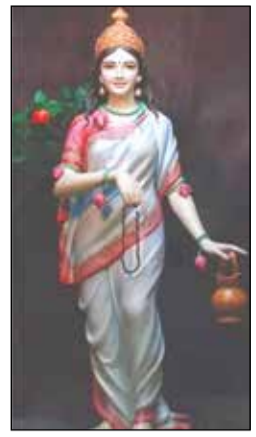
ದಧಾಣ ಕರಪದ್ಮಾ ಭಾಗ್ಯಮುಕ್ತ ಮಾಲಾಕ ಮಂಡಲಂ ದೇವಿ ಪ್ರಸಾದವತು ಮುಖ ಬ್ರಹ್ಮ ಚಾರಿಣ್ಯ ನುತನವಾ'