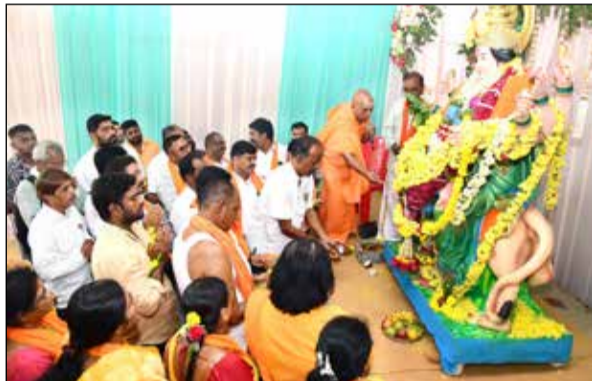
ನಗರ ದೇವತೆ ಮಗ್ಗುವು