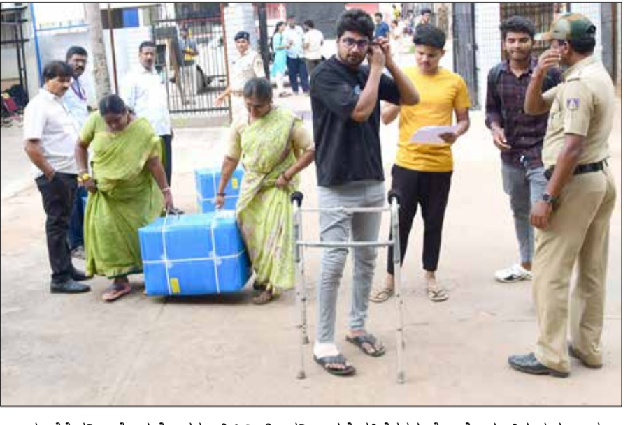
ದಾವಣಗೆರೆ ಪರಿಶಿಷ್ಟ ಕೇಂದ್ರವೊಂದರ ಬಳಿ ಪಿಎಸ್‌ಐ ಪರಿಶಿಷ್ಟ ಪತ್ರಿಕೆಗಳನ್ನು ಕೊಂಡೊಯ್ಯುತ್ತಿರುವ ಹಾಗೂ ಪರಿಶಿಷ್ಟ ಬಂದ ಅಭ್ಯರ್ಥಿಯೊಬ್ಬರು ಕಿವಿಗಿ ಹಾಕಿಕೊಂಡಿದ್ದ ಓಲೆ ತೆಗೆಸುತ್ತಿರುವ ಪೊಲೀಸ್ ಒಬ್ಬರು.