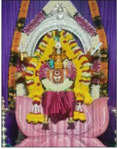
ಎಸ್.ಕೆ. ರಸ್ತೆಯ ಕನ್ನಿಕಾ ಪರಮೇಶ್ವರಿ ದೇವಸ್ಥಾನದಲ್ಲಿ ಕನ್ನಿಕಾಪರಮೇಶ್ವರಿ ಅಮೃತವರಿಗೆ ಬ್ರಾಹ್ಮಣದೇವಿ ಅಲಂಕಾರ