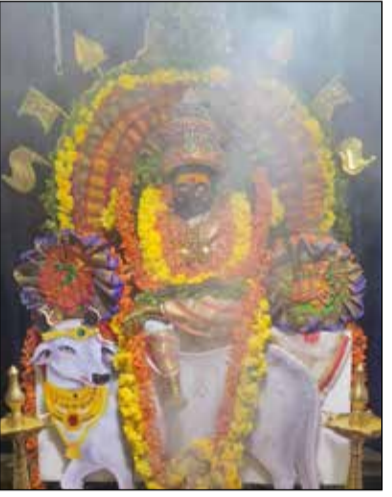
ಶಾಮನೂರಿನ ಶ್ರೀ ಮಂಗಳಗೌರಿ ದೇವಸ್ಥಾನದಲ್ಲಿ ಶ್ರೀ ದೇವಿಗೆ 1ನೇ ದಿನದ ಶೈಲಪುತ್ರಿ ಅಲಂಕಾರ.