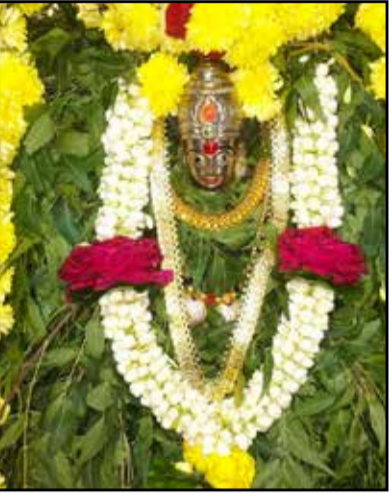
ಎಸ್. ಓ. ಜಿ ಕಾಲೋನಿಯ ಕರ್ಮಪಾಲದಾಶ ಶ್ರೀ ಶನೈಶ್ವರ ಸ್ವಾಮಿಯ ಸನ್ನಿಧಿಯಲ್ಲಿ ಶ್ರೀ ಚೌಡೇಶ್ವರಿ ಅಮೃತವರಿಗೆ ವಿಶೇಷ ಅಲಂಕಾರ