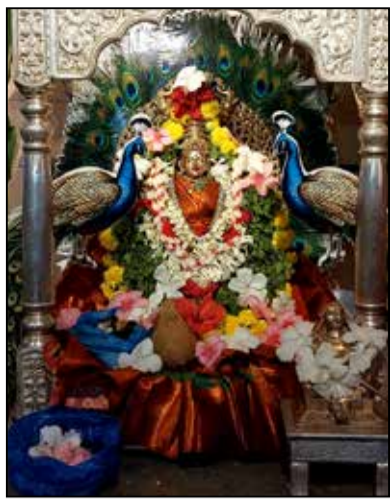
ಜಯದೇವ ವೃತ್ತ ಶಂಕರ ಮಠ ಶ್ರೀ ಶಾರದಾ ತರನವರಾತ್ರಿ ಉತ್ಸವ ಪ್ರಯುಕ್ತ ಶೈಲಪುತ್ರಿ ಆರಾಧನೆ