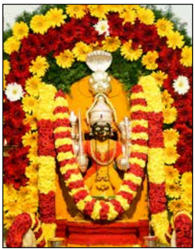
ದಾವಣಗೆಡೆ ಶ್ರೀ ಚೌಡೇಶ್ವರಿ ದೇವಿಗೆ ಅರಿಶಿಣ, ಕುಂಕುಮ ಅಲಂಕಾರ