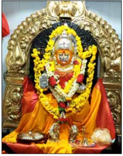
ಕೆಟೆ ನಗರ 9ನೇ ತಿರುವಿನಲ್ಲಿರುವ ಶ್ರೀ ತುಳಜಾಭವಾನಿ ದೇವಸ್ಥಾನದಲ್ಲಿ ಶ್ರೀ ದೇವಿಗೆ ವಿಶೇಷ ಅಲಂಕಾರ