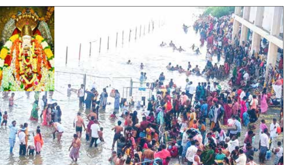
ಮಲೇಬೆನ್ನೂರು, ಅ. 3 - ಮಹಾಲಯ ಅಮಾವಾಸ್ಯೆ ಗುರು ಕರಿಬಸವೇಶ್ವರ ಅಭಯನ ದರ್ಶನ ಪಡೆಯಲು ಪ್ರಯುಕ್ತ ಸುಕ್ಕೇತ್ರ ಉಕ್ಕಡಗಾತ್ರಿಯಲ್ಲಿ ಪವಾಡ ಪುರುಷ ಶ್ರೀ ಮಂಗಳವಾರ ರಾತ್ರಿಯಿಂದಲೇ ಸಾವಿರಾರು ಭಕ್ತರು ಜಮಾಗೊಂಡಿದ್ದರು.

ಭಕ್ತರು ತುಂಗಭದ್ರಾ ನದಿಯ ಸ್ನಾನ ಘಟ್ಟದಲ್ಲಿ ಪುಣ್ಯ ಸ್ನಾನ ಮಾಡಿದ ನಂತರ ವಿಶಿಷ್ಟ ಪೂಜೆ, ಪುನಸ್ಕಾರಗಳನ್ನು ಮಾಡಿದರು. ನಿಂಬ ಹಣ್ಣುಗಳ ರಾಶಿ ಮೇಲೆ ಗಂಧ, ಹಣ್ಣು ಎನ್ನದೆ ದಿಂಡುಕುರು ಸೇವೆ ಸಲ್ಲಿಸಿದರು. ಭೂತ ಪ್ರೇತ ಆವಾಹನ ಆದವರು ಅಭಯನ ಸನ್ನಿಧಿಯ ಅಂಚೆ ದೂರದಲ್ಲಿ 'ಅಭಯ್ಯ ಬಿಡು, ನನ್ನ ಕಾಡಬೇಡ' ಎಂದು ಚೀರುತ್ತಿದ್ದ ದೃಶ್ಯ ಸಾಮಾನ್ಯವಾಗಿತ್ತು. ಭೂತ, ಪ್ರೇತ ನಿವಾರಣೆ, ವ್ಯಾಜ್ಯ, ಕಂಕಣ ಭಾಗ್ಯ, ಸಂತಾನ ಭಾಗ್ಯ, ಉದ್ಯೋಗ, ರೋಗ ರಚನೆಗಳ ಪರಿಹಾರಕ್ಕೆ ಅಭಯ್ಯ ಎಂಬ ನಂಬಿಕೆಯಿಂದ ಪರಿಹಾರ ಕಂಡವರು ಬಂದು ಹರಕೆ ತೀರಿಸಿದರು. ಕೆಲವರು ಮುಡಿ ತೆಗೆಸಿದರು. ಹೊರ ರಾಜ್ಯಗಳಿಂದಲೂ ಭಕ್ತರು ಉಕ್ಕಡಗಾತ್ರಿಗೆ ಬಂದು ಅಭಯ್ಯನ ದರ್ಶನ ಪಡೆದರು. ಭಕ್ತರಿಗೆ ತಂಗಲು ವಸತಿ ಗೃಹಗಳಲ್ಲಿ ವ್ಯವಸ್ಥೆ ಮತ್ತು ಊಟದ ವ್ಯವಸ್ಥೆಯನ್ನು ದೇವಸ್ಥಾನದ ಟ್ರಸ್ಟ್ ವತಿಯಿಂದ ಮಾಡಲಾಗಿತ್ತು. ಅಭಯ್ಯನ ಗದ್ದಿಗೆ ಅಭಿಷೇಕ ಮತ್ತು ವಿಶೇಷ ಪೂಜಾಂಕಾರ ಮಾಡಲಾಗಿತ್ತು.