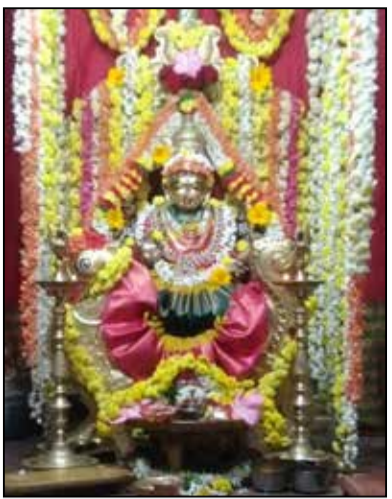
ನಿಜಲಿಂಗಪ್ಪ ಬಡಾವಣೆಯ ಶ್ರೀ ಶಾರದಾ ಪರಮೇಶ್ವರಿ ಈ ದಿನದ ಪಂಸವಾಚನ ಅಲಂಕಾರ