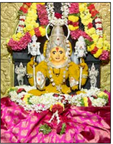
ಶ್ರೀ ಕಾಳಿಕಾದೇವಿ ವಿಶ್ವಕರ್ಮ ದೇವಸ್ಥಾನದಲ್ಲಿ ಶ್ರೀದೇವಿಗೆ ಅರಿಶಿಣ ಅಲಂಕಾರ