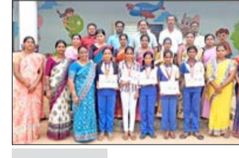
ಹರಪನಹಳ್ಳಿ, ಸೆ. 22 - ಇತ್ತೀಚೆಗೆ ಜರುಗಿದ ತಾಲ್ಲೂಕು ಮಟ್ಟದ ಕ್ರೀಡಾಕೂಟದಲ್ಲಿ ಪಟ್ಟಣದ ತರಳಬಾಳು ಆಂಗ್ಲ ಮಾಧ್ಯಮ ಹಿರಿಯ ಪ್ರಾಥಮಿಕ ಶಾಲೆಯ ವಿದ್ಯಾರ್ಥಿಗಳು ತಾಲ್ಲೂಕು ಮಟ್ಟದ ಹಿರಿಯ ಪ್ರಾಥಮಿಕ ಶಾಲಾ ಮಕ್ಕಳ ಕ್ರೀಡಾ ಕೂಟದಲ್ಲಿ ಭಾಗವಹಿಸಿ