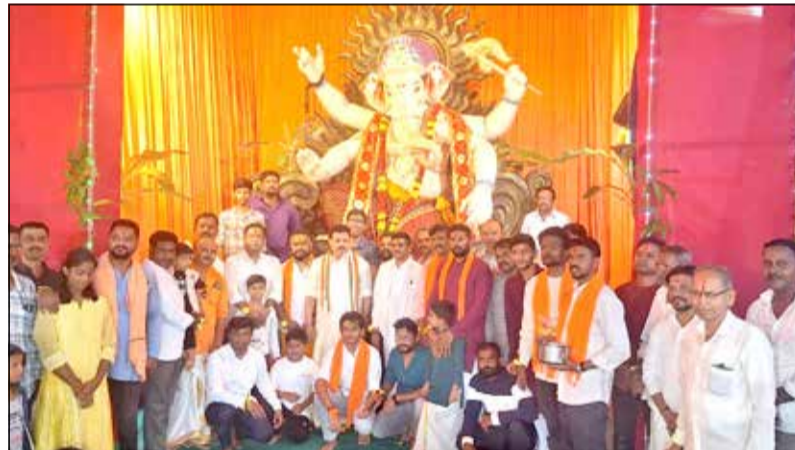
ನಗರದ ಪೇಟೆ ಅಂಜನೇಯ ಸ್ವಾಮಿ ದೇವಸ್ಥಾನದ ಆವರಣದಲ್ಲಿ ಹಿಂದೂ ಜಾಗರಣ ವೇದಿಕೆ ಮತ್ತು ಹಿಂದೂ ಮಹಾ ಗಣಪತಿ ವತಿಯಿಂದ ಗಣೇಶೋತ್ಸವದ ಅಂಗವಾಗಿ ಗಣೇಶ ಮೂರ್ತಿ ಪ್ರತಿಷ್ಠಾಪನೆ