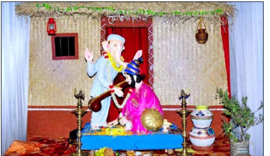
ಮಹಾರಾಜಪೇಟೆಯ ವಿಠಲ ಮಂದಿರದಲ್ಲಿ ಶ್ರೀ ಭಾವಸಾರ ಕೃತ್ರಿಯ ತರುಣ ಮಂಡಳಿಯಿಂದ ಶ್ರೀ ಸಂತ ಜಗದ್ಗುರು ದಿನವಾದ ಇಂದು ಗಣೇಶ ವಿಸರ್ಜನೆ ಪ್ರಯುಕ್ತ ಮಧ್ಯಾಹ್ನ ಶಿವ ಭಕ್ತಪತಿ ಶಿವಾಜಿ ಮಹಾರಾಜರ ಭೇಟಿಯ ರೂಪದಲ್ಲಿ ಗಣಪತಿ ದೇವರ ದೃಶ್ಯ.