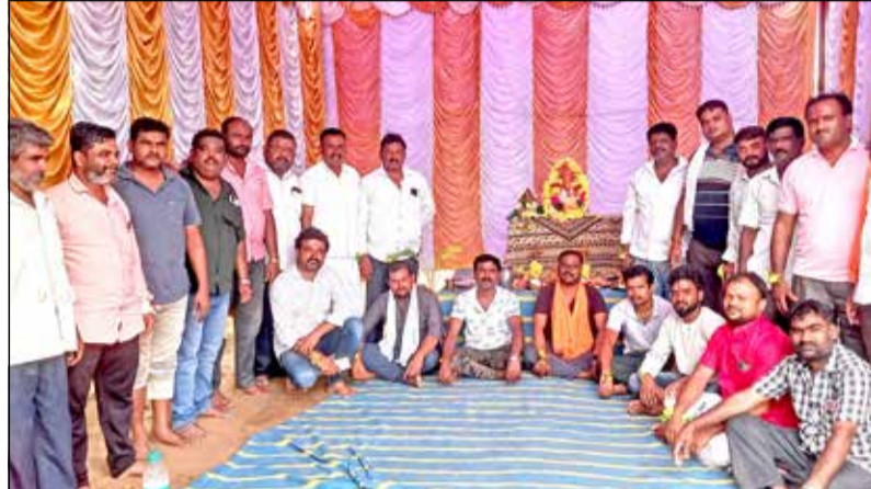
ನಗರದ ಟ್ಯಾಕ್ಸಿ ಹಾಗೂ ಕಾರು ಮಾಲೀಕರು ಮತ್ತು ಚಾಲಕರ ಸಂಘದ ವತಿಯಿಂದ ವಿನಾಯಕ ಮಹೋತ್ಸವದ ಅಂಗವಾಗಿ ಗಣಪತಿ ಪ್ರತಿಷ್ಠಾಪನೆ, ಅದ್ದೂರಿ ಮೆರವಣಿಗೆ ಮೂಲಕ ಗಣೇಶ ಮೂರ್ತಿ ವಿಸರ್ಜನೆ.