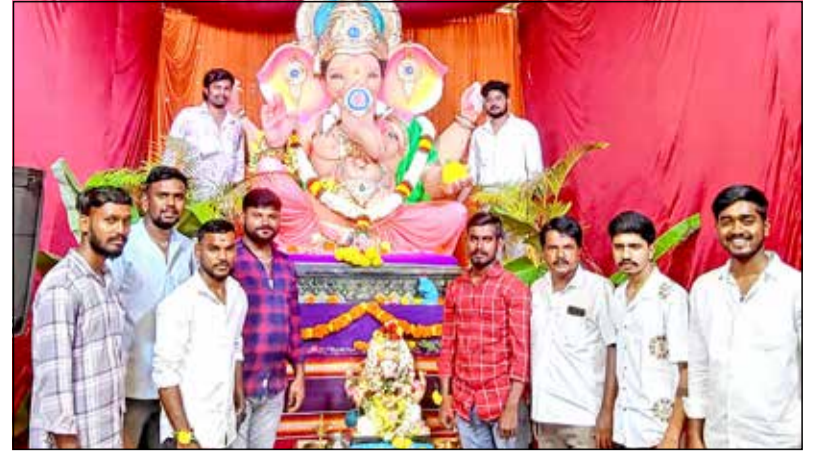
ನಗರದ ನಡವಲಪೇಟೆ ಬಸವೇಶ್ವರ ಯುವಕ ಸಂಘದ ವತಿಯಿಂದ ಗಣೇಶೋತ್ಸವ ಅಂಗವಾಗಿ ಗಣಪತಿ ಮೂರ್ತಿ ಪ್ರತಿಷ್ಠಾಪನೆ