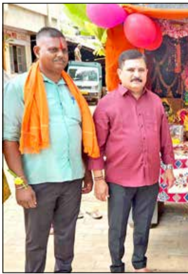
ಬಂಜೂ ಬಜಾರ್‌ನ ಗೂಡ್ಸ್ ಆಟೋ ಚಾಲಕರ ಸಂಘದಿಂದ ಪ್ರತಿಷ್ಠಾಪಿಸಿರುವ ಶ್ರೀ ಗಣೇಶ ಮೂರ್ತಿ