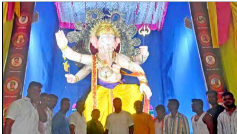
ನಗರದ ಹೊಸಭರಂಪುರ ಬಡಾವಣೆಯ ಶ್ರೀ ಗ್ರಾಮದೇವತೆ ಭರಂಪುರ ಯುವಕ ಸಂಘದ ವತಿಯಿಂದ ವಿನಾಯಕ ಮಹೋತ್ಸವದ ಅಂಗವಾಗಿ 18 ಅಡಿ ಎತ್ತರದ ಗಣೇಶ ಮೂರ್ತಿ ಪ್ರತಿಷ್ಠಾಪನೆ