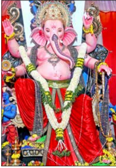
ಓಂ ಯುವಕರ ಸಂಘ, ಆಂಜನೇಯ ಬಡಾವಣೆ ವೃತ್ತ