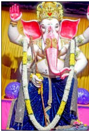
ಪೊಲೀಸ್ ಥಾಟ್ರಸ್, ಅರುಣಾ ಟಾಕೀಸ್ ರಸ್ತೆ