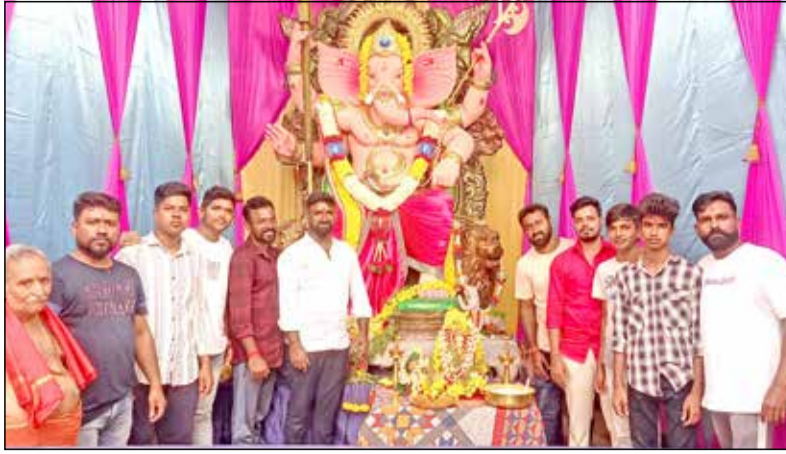
ನಗರದ ಮರಾಠಿಗಳಿಂದ ಮಿತ್ರವೃಂದ ಯುವಕ ಮಂಡಳಿ ವತಿಯಿಂದ 11 ಅಡಿ ಎತ್ತರದ ತೇಜೋರಾಮ್ ಗಣೇಶಮೂರ್ತಿ ಪ್ರತಿಷ್ಠಾಪನೆ