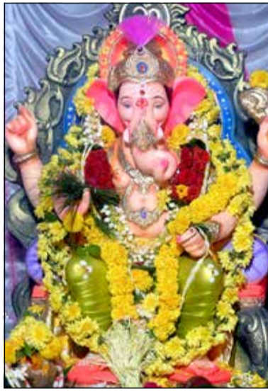
ಶ್ರೀರಾಮ್ ಸೇನಾ, ಆಂಜನೇಯ ಬಡಾವಣೆ, 13ನೇ ಕ್ರಾಸ್