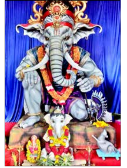
ಸ್ವಜನಶಿಲ ಬಳಗ, ಎಸ್.ಎಸ್. ಲೇ ಔಟ್ 'ಬಿ' ಬ್ಲಾಕ್