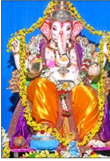
ಚೈಂದ್ ಕೆರೆ ಗರಡಿ, ಮದಕರಿ ನಾಯಕ ವೃತ್ತ