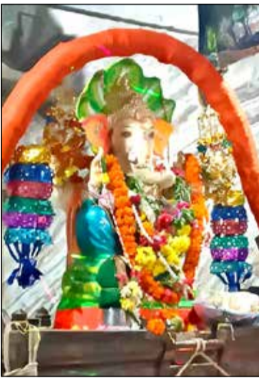
ಕಾಡಪ್ಪ ಸರ್ಕಲ್‌ನಲ್ಲಿ ಶ್ರೀ ಗಣೇಶ ಮಹೋತ್ಸವ