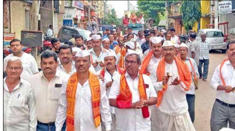
ನಗರದ ನಾಮದೇವ ಸಿಂಹ ಸಮಾಜದ ವತಿಯಿಂದ ನಾಮದೇವ ಕಲ್ಯಾಣ ಮಂಟಪದ ಸಭಾಂಗಣದಲ್ಲಿ ಗಣೇಶೋತ್ಸವದ ಅಂಗವಾಗಿ ಗಣಪತಿ ಮೂರ್ತಿಯನ್ನು ಅದ್ದೂರಿ ಮೆರವಣಿಗೆಯೊಂದಿಗೆ ಪ್ರತಿಷ್ಠಾಪನೆ