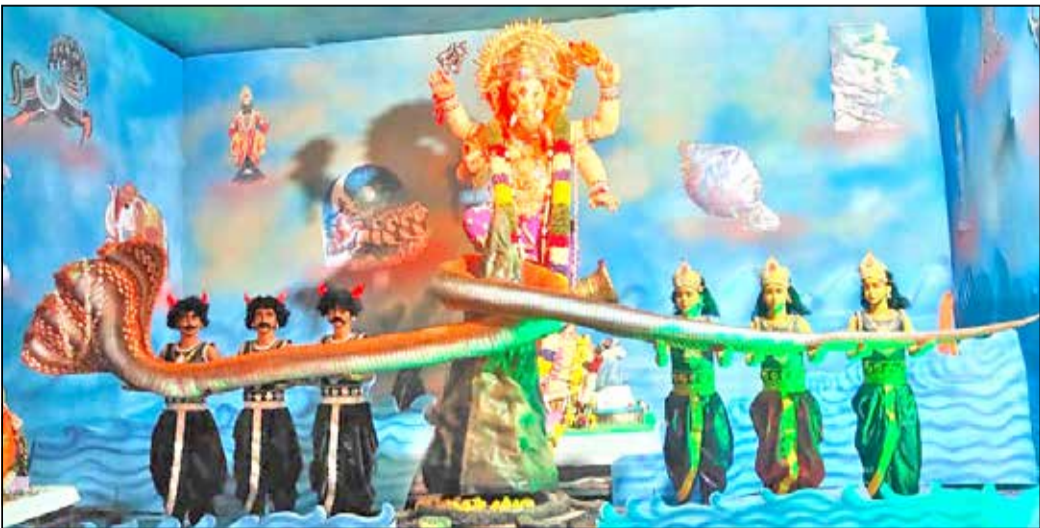
ಶಾಮನೂರಿನ ಶ್ರೀ ಆಂಜನೇಯ ದೇವಸ್ಥಾನದ ಪಕ್ಕದಲ್ಲಿ ಶ್ರೀ ವಿನಾಯಕ ಶೈಲ ಬಳಗದಿಂದ ಸಮುದ್ರ ಮಂಥನ ರೂಪದಲ್ಲಿ ಗಣೇಶ ಪ್ರತಿಷ್ಠಾಪನೆ