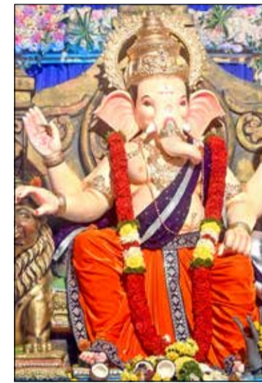
ವಿಜಯನಗರ ಬಡಾವಣೆಯ ವಿನಾಯಕ ಬಳಗ