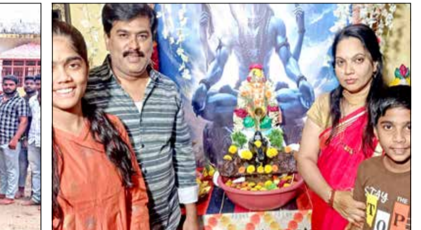
ನಗರದ ದೇವಸ್ಥಾನ ರಸ್ತೆಯ ಮನೆಯೊಂದರಲ್ಲಿ ಗಣೇಶೋತ್ಸವದ ಅಂಗವಾಗಿ ಗಣಪತಿಯು ಶಿವಲಿಂಗಕ್ಕೆ ನೀರಿನ ಅಭಿಷೇಕ ಮಾಡುವ ವಿಶೇಷ ಅಲಂಕಾರ.