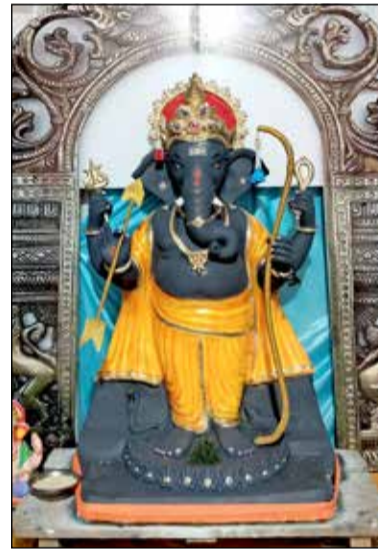
ಶ್ರೀ ರಾಮನ ಆವತಾರದಲ್ಲಿ ವಿನಾಯಕ, ಸ್ವಾಗೇರಪೇಟೆ