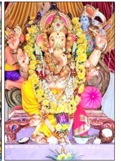
ವಿಜಯನಗರ ಬಡಾವಣೆಯ ವಿನಾಯಕ ಬಳಗ