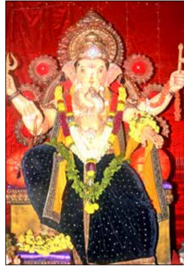
ಡ್ರೀಮ್ ಬಾಯ್ಸ್ ಯುವಕರ ಸಂಘ, ಬಿಬ್ಬಾಟ ರಸ್ತೆ