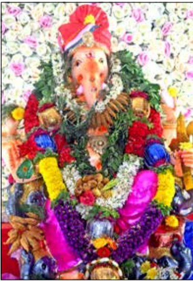
ಶ್ರೀ ನವಭಾರತ ವಿಘ್ನೇಶ್ವರ ಯುವಕರ ಸಂಘ