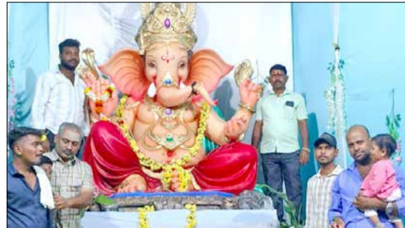
ನಗರದ ತರಕಾರಿ ವ್ಯಾಪಾರಸ್ಥರ ಸಂಘದ ವತಿಯಿಂದ, ವಿನಾಯಕ ಮಹೋತ್ಸವ ಅಂಗವಾಗಿ ತರಕಾರಿ ಮಾರುಕಟ್ಟೆ ಆವರಣದಲ್ಲಿ ಗಣೇಶ ಪ್ರತಿಷ್ಠಾಪನೆ