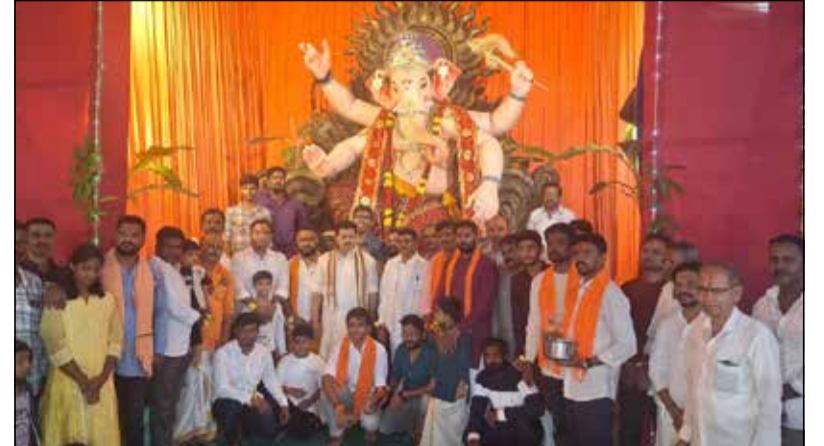
ನಗರದ ಪೇಟೆ ಅಂಜನೇಯ ಸ್ವಾಮಿ ದೇವಸ್ಥಾನದ ಆವರಣದಲ್ಲಿ ಹಿಂದೂ ಜಾಗರಣ ವೇದಿಕೆ ಮತ್ತು ಹಿಂದೂ ಮಹಾ ಗಣಪತಿ ವತಿಯಿಂದ ಗಣೇಶೋತ್ಸವದ ಅಂಗವಾಗಿ ಗಣೇಶ ಮೂರ್ತಿ ಪ್ರತಿಷ್ಠಾಪನೆ