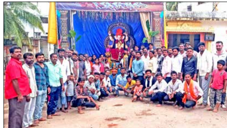
ನಗರದ ಶಿವಾರ ವೃತ್ತದ 70 ನೇ ವರ್ಷದ ಸಾರ್ವಜನಿಕ ವಿನಾಯಕ ಮಹೋತ್ಸವದ ಅಂಗವಾಗಿ ವಿನಾಯಕ ಮೂರ್ತಿಗೆ ವಿಶೇಷ ಪೂಜೆ, ಅಲಂಕಾರ ಮಹಾಮಂಗಳಾರತಿ