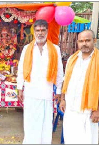
ಶ್ರೀ ಗಜಾನನ ಪೈಂಡ್ಸ್ ಗ್ರೂಪ್, ವಿದ್ಯಾನಗರ