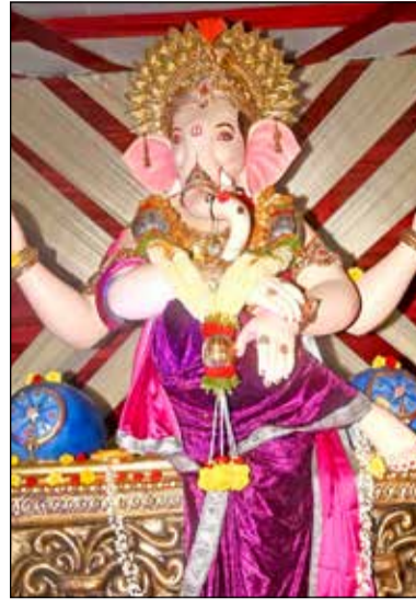
ಶ್ರೀ ಬೀರಲಿಂಗೇಶ್ವರ, ಕಟ್ಟಿಮಗ್ಗಮ್ಮ ಗೆಳೆಯರ ಬಳಿ