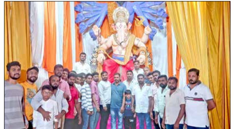
ನಗರದ ದೊಡ್ಡಿಬೀದಿಯ ಜೈ ಹನುಮಾನ್ ಗರಡಿ ಮನೆ ಯುವಕ ಸಂಘದ ವತಿಯಿಂದ 15 ಅಡಿ ಎತ್ತರದ ಶ್ರೀ ವಿನಾಯಕ ಮೂರ್ತಿ ಪ್ರತಿಷ್ಠಾಪನೆ