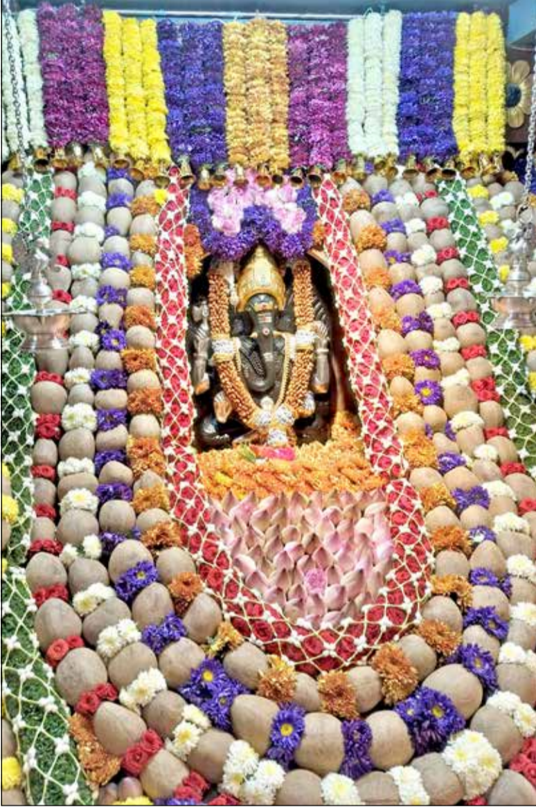
ದೊಡ್ಡಪೇಟೆಯ ಶ್ರೀ ಗಣೇಶ ದೇವಸ್ಥಾನದಲ್ಲಿ ಬಣ ಕೊಬ್ಬರಿ ಗಣಪ ಅಲಂಕಾರ