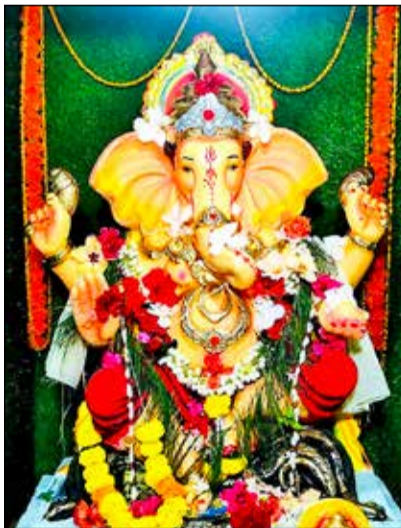
ಕುಂಬಳೂರು ಗ್ರಾಮದ ಶ್ರೀ ಗಂಗಾಪರಮೇಶ್ವರಿ ದೇವಸ್ಥಾನದಲ್ಲಿ 33 ನೇ ವರ್ಷದ ಗಣಪತಿ ಪ್ರತಿಷ್ಠಾಪನೆ