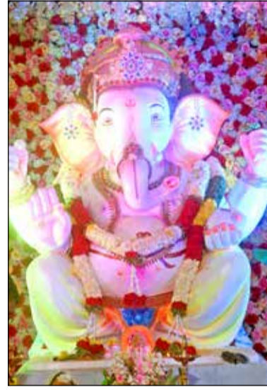
ಓಂ ಮಹಾಸಭಾ ಗಣಪತಿ, ಎಂ.ಸಿ.ಸಿ. ಬಿ ಬ್ಲಾಕ್