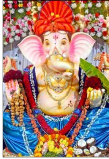
ಸೈ ಗ್ರೂಪ್, ಬಿಬ್ಬಾಟ ರಸ್ತೆ