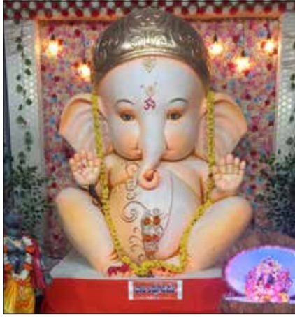
ನಡವಲಪೇಟೆ ಯುವಕ ಸಂಘದಿಂದ ಗಣೇಶೋತ್ಸವದ ಅಂಗವಾಗಿ ಬಾಲ್ಯ ಲಡ್ಡು ಗಣಪತಿ ಪ್ರತಿಷ್ಠಾಪನೆ