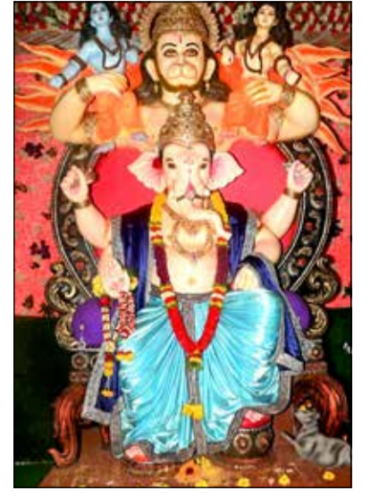
ಶ್ರೀರಾಮ್ ಯುವ ಸೇನೆ, ವಿದ್ಯಾನಗರ