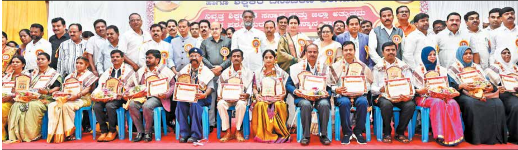
ದಾವಣಗೆರೆ ಬಾಪೋಜಿ ಬ್ಯಾಂಕ್ ಸಮುದಾಯ ಭವನದಲ್ಲಿ ಗುರುವಾರ ನಡೆದ ಶಿಕ್ಷಕರ ದಿನಾಚರಣೆ ಕಾರ್ಯಕ್ರಮದಲ್ಲಿ ಜಿಲ್ಲಾ ಅತ್ಯುತ್ತಮ ಶಿಕ್ಷಕರ ಪ್ರಶಸ್ತಿ ಪ್ರದಾನ ಮಾಡಲಾಯಿತು.