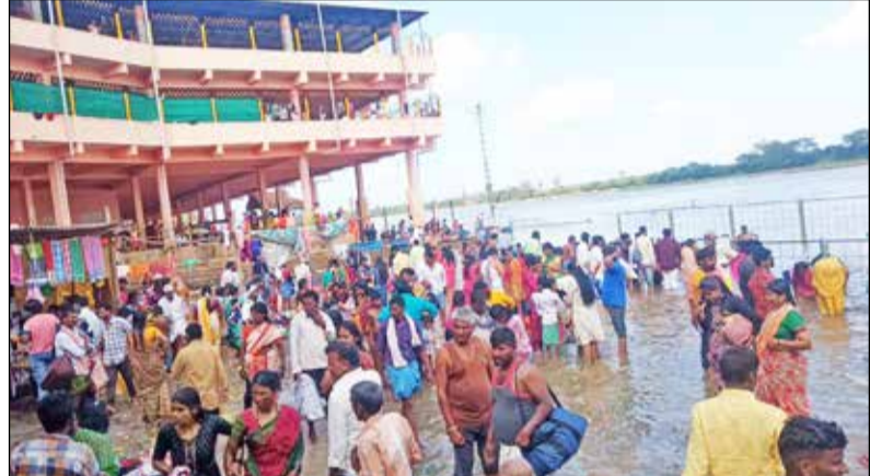
ದರ್ಶನ ಪಡೆದು ಪ್ರಸಾದ ಸ್ವೀಕರಿಸಿದರು. ಈ ಹಿಂದೆ ಅಂಗವಾಗಿ ಅಜ್ಜಯ್ಯನಿಗೆ ವಿಶೇಷ ಅಲಂಕಾರ, ಪೂಜೆ ಮತ್ತು ಕರ್ತೃ ಗದ್ದುಗೆಗೆ ರುದ್ರಾಭಿಷೇಕ ತೀರಿಸಿದರು. ಶ್ರಾವಣ ಮಾಸದ ಕೊನೆಯ ಮಾಡಲಾಗಿತ್ತು ಭಕ್ತರಿಗೆ ವಸತಿ ಹಾಗೂ ಅನ್ನ ಸಂತರ್ಪಣೆ ವ್ಯವಸ್ಥೆ ಮಾಡಲಾಗಿತ್ತು.

ಮಲೇಬೆನ್ನೂರು, ಸೆ. 3- ಸುಕೇತ್ರ ಉಕ್ಕಡಗಾತ್ರಿಯಲ್ಲಿ ಸೋಮವಾರ ಬೆನಕನ ಅಮಾವಾಸ್ಯೆ ಪ್ರಯುಕ್ತ ಪವಾಡ ಪುರುಷ ಶ್ರೀ ಗುರು ಕರಬಸವೇಶ್ವರ ಅಜ್ಜಯ್ಯನ ದರ್ಶನಕ್ಕೆ ಭಕ್ತರು ತುಂಗಭದ್ರಾ ನದಿ ನೀರಿನಂತೆ ಹರಿದು ಬಂದಿದ್ದರು. ಅಜ್ಜಯ್ಯನ ದರ್ಶನಕ್ಕೆ ಬಂದ ಭಕ್ತರು ತುಂಗಭದ್ರಾ ನದಿಯ ಸ್ನಾನ ಘಟ್ಟದಲ್ಲಿ ಪೂಜೆ ಮಾಡಿ ಉರುಳು ಸೇವೆ ಮಾಡಿ ಭಕ್ತಿಸಮರ್ಪಿಸಿದರು. ನಂತರ ಸ್ನಾನ ಘಟ್ಟದಲ್ಲಿ ಪ್ರತಿಷ್ಠಾಪಿತ ಗಣೇಶ ವಿಗ್ರಹಕ್ಕೆ ಪೂಜೆ ಸಲ್ಲಿಸಿದರು. ಕೆಲವು ಭಕ್ತರು ತಲೆ ಮೇಲೆ ಅಜ್ಜಯ್ಯನ ಪೋಟೋ ಹೊತ್ತರೆ, ಇನ್ನೂ ಕೆಲವು ಭಕ್ತರು ತಲೆಮೇಲೆ ಕಲ್ಲು ಹೂತ್ತು ಹರಕೆ ಕಟ್ಟಿಕೊಳ್ಳುತ್ತಿರುವುದು ಕಂಡು ಬಂತು. ಕಳಸ ಹೂಡಿ, ಹಣ್ಣು-ಕಾಯಿ, ನಿಂಬೆ ಹಣ್ಣು, ಕರ್ಪೂರ, ಉದ್ದಿನ ಕಡ್ಡಿ, ಅರಿಷೀನ, ಚಂದನ ಹಚ್ಚಿ ಪೂಜೆ ಮಾಡಿ ಹರಕೆ ಕಟ್ಟಿಕೊಂಡರು. ನಂತರ ಸರತಿ ಸಾಲಿನಲ್ಲಿ ಬಂದು ಅಜ್ಜಯ್ಯನ