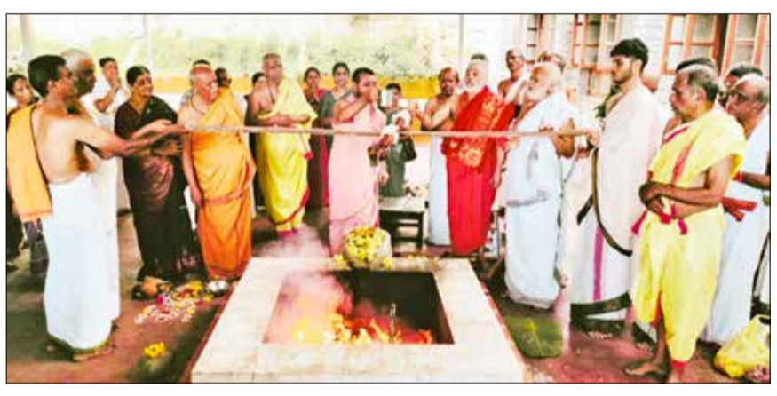
ಮಲೇಬೆನ್ನೂರು, ಆ.25- ಸಮೀಪದ ಭಗವಾನ್ ಸರಸ್ವತಿಗಳ 144 ನೇ ಜಯಂತಿ ಅಂಗವಾಗಿ ಕೊಮಾರನಹಳ್ಳಿ ಗ್ರಾಮದಲ್ಲಿರುವ ಶ್ರೀ ಬುಧವಾರ ಶಂಕರಲಿಂಗ ಮತ್ತು ಲೋಕಕಲ್ಯಾಣಾರ್ಥವಾಗಿ ಟ್ರಸ್ಟ್ ನವರು ಲಲಿತಾ ಹೋಮ ಮಾಡಿದರು.