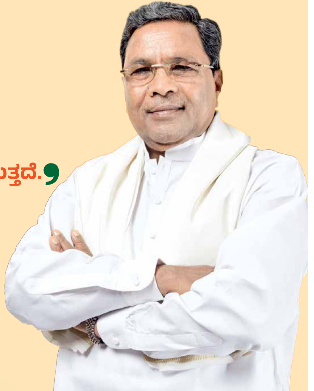
ಶ್ರೀ ಸಿದ್ದರಾಮಯ್ಯ ಸನ್ಮಾನ್ಯ ಮುಖ್ಯಮಂತ್ರಿಗಳು