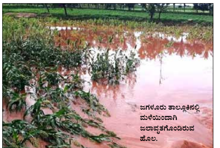
ಜಗಳೂರು ತಾಲ್ಲೂಕಿನಲ್ಲಿ ಮಳೆಯಿಂದಾಗಿ ಜಲಾವೃತಗೊಂಡಿರುವ ಹೊಲ.

ದಾವಣಗೆರೆ, ಆ. 14 - ಬುಧವಾರ ಬೆಳಿಗಿನ ಜಾವ ನಗರದಲ್ಲಿ ಸುಂದ ಧಾರಾಕಾರ ಮಳೆಯಿಂದಾಗಿ, ತಗ್ಗು ಪ್ರದೇಶಗಳಲ್ಲಿ ನೀರು ಸುಗ್ಗಿದೆ. ನಗರದ ಶೇಖರಪ್ಪ ನಗರ, ಭರತ್ ಕಾಲೋನಿ, ಈರುಳ್ಳಿ ಮಾರುಕಟ್ಟೆ, ಬಂಬೂ ಬಜಾರ್ ಸೇರಿದಂತೆ ಹಲವೆಡೆ ತಗ್ಗು ಪ್ರದೇಶಗಳ ಜನರು ಸಮಸ್ಯೆ ಎದುರಿಸಿದರು. ಮಂಡ್ಯಕ್ಕೆ ಭಟ್ಟ ಬಳಿಯ ನಾಗನಹಳ್ಳಿ ಹಳ್ಳದಲ್ಲಿ ನೀರು ಉಕ್ಕಿ ಹರಿದಿತ್ತು. ಬೇತೂರು ಗ್ರಾಮದ ತಗ್ಗು ಪ್ರದೇಶಗಳ ನೀರು ಸುಗ್ಗಿತ್ತು. ಹೆಚ್. ಕಲ್ಲನಹಳ್ಳಿ ಗ್ರಾಮದಲ್ಲೂ ನೀರು ಸುಗ್ಗಿ ಸಮಸ್ಯೆ ಉಂಟಾಗಿತ್ತು. ದಾವಣಗೆರೆ ಜಿಲ್ಲೆಯಲ್ಲಿ ಒಟ್ಟಾರೆ 34.7 ಮಿ.ಮೀ. ಮಳೆಯಾಗಿದೆ. ಜಗಳೂರು ತಾಲ್ಲೂಕಿನಲ್ಲಿ ಅತಿ ಹೆಚ್ಚಿನ 71.7