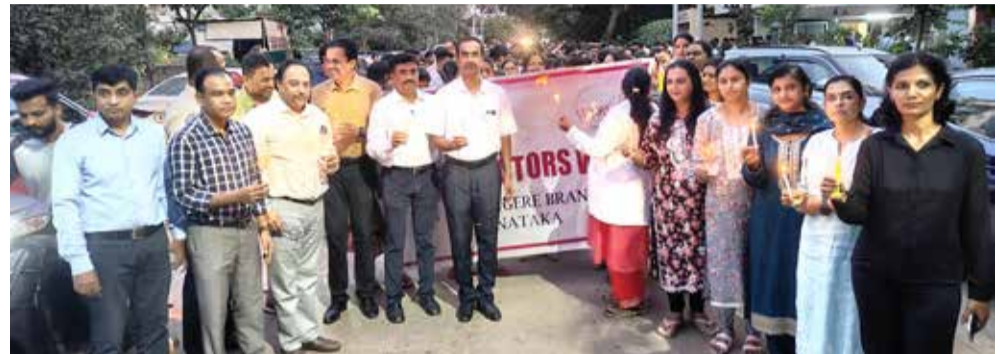
ದಾವಣಗೆರೆಯ ಐ.ಎಂ.ಎ. ಘಟಕದ ವತಿಯಿಂದ ಪ್ರತಿಭಟನೆ ಹಾಗೂ ಕ್ಯಾಂಡಲ್ ಲೈಟ್ ಮೆರವಣಿಗೆ ನಡೆಸಲಾಯಿತು.