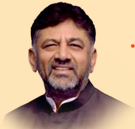
ಶ್ರೀ ಡಿ. ಕೆ. ಶಿವಕುಮಾರ್ ಮಾನ್ಯ ಉಪಮುಖ್ಯಮಂತ್ರಿಗಳು

... ಸಿಕ್ಕಾಗ ಮಾತ್ರ ನಿಜವಾದ ಸ್ವಾತಂತ್ರ್ಯ ಸಿಕ್ಕಿದಂತಾಗುತ್ತದೆ.