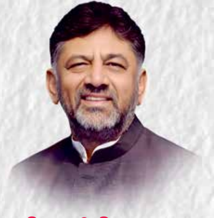
ಶ್ರೀ ಡಿ.ಕೆ. ಶಿವಕುಮಾರ್ ಮಾನ್ಯ ಉಪ ಮುಖ್ಯಮಂತ್ರಿಗಳು