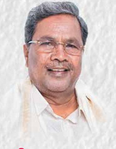
ಶ್ರೀ ಸಿದ್ದರಾಮಯ್ಯ ಸನ್ಮಾನ್ಯ ಮುಖ್ಯಮಂತ್ರಿಗಳು

ಜಿಲ್ಲಾಡಳಿತ, ಜಿಲ್ಲಾ ಪಂಚಾಯತ್, ಸಮಾಜ ಕಲ್ಯಾಣ ಇಲಾಖೆ, ಜಾಮರಾಜನಗರ ಜಿಲ್ಲೆ.