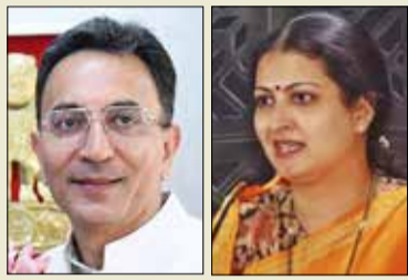
ಸಂಸದೆ ಡಾ. ಪ್ರಭಾ ಪ್ರಶ್ನೆಗೆ ಸಚಿವ ಜಿ.ಪಿ.ಪ್ರಸಾದ್ ಭರವಸೆ

ನವದೆಹಲಿ, ಆ. 7 - ದಾವಣಗೆರೆ ನಗರದಲ್ಲಿ 2 ಎಕರೆ ಜಾಗ ಹಾಗೂ 50 ಸಾವಿರ ಚದುರ ಅಡಿ ಪ್ರದೇಶದ ಕಟ್ಟಡ ಒದಗಿಸಿದಲ್ಲಿ ಐ.ಟಿ. ಪಾರ್ಕ್ ಸ್ಥಾಪಿಸಲು ಪರಿಶೀಲಿಸಲಾಗುವುದು ಎಂದು ಕೇಂದ್ರ ಎಲೆಕ್ಟ್ರಾನಿಕ್ಸ್ ಹಾಗೂ ಮಾಹಿತಿ ತಂತ್ರಜ್ಞಾನ ಸಚಿವ ಜಿ.ಪಿ. ಪ್ರಸಾದ್ ಭರವಸೆ ನೀಡಿದ್ದಾರೆ. ಲೋಕಸಭೆಯಲ್ಲಿ ದಾವಣಗೆರೆ ಸಂಸದ ಪ್ರಭಾ ಮಲ್ಲಿಕಾರ್ಜುನ್ ಕೇಳಿದ ಪ್ರಶ್ನೆಗೆ ಉತ್ತರಿಸಿದ ಅವರು, ದಾವಣಗೆರೆಯಲ್ಲಿ ಈಗಾಗಲೇ ಎಸ್.ಟಿ.ಪಿ.ಐ. (ಸಾಫ್ಟ್‌ವೇರ್ ಟೆಕ್ನಾಲಜಿ ಪಾರ್ಕ್ ಆಫ್ ಇಂಡಿಯಾ) ಉಪ ಕೇಂದ್ರ ಕಾರ್ಯನಿರ್ವಹಿಸುತ್ತಿದೆ. ಇದು 10 ಸಾವಿರ ಚದುರಡಿ ಜಾಗ ಹೊಂದಿದೆ ಎಂದು ಹೇಳಿದರು. ರಾಜ್ಯ ಸರ್ಕಾರ 2 ಎಕರೆ ಪ್ರದೇಶ ಹಾಗೂ 50 ಸಾವಿರ ಚದುರ ಅಡಿ ಜಾಗದ ಕಟ್ಟಡ ಒದಗಿಸಿದರೆ ಮಾತ್ರ ಐ.ಟಿ. ಪಾರ್ಕ್ ಸ್ಥಾಪಿಸಬೇಕು ಎಂಬುದು ಕೇಂದ್ರ ಸರ್ಕಾರದ ಈಗಿನ ನೀತಿಯಾಗಿದೆ ಎಂದವರು ಹೇಳಿದರು. ದಾವಣಗೆರೆಯಲ್ಲಿ ಈಗಿರುವ ಎಸ್.ಟಿ.ಪಿ.ಐ. ಉಪ ಕೇಂದ್ರದಲ್ಲಿ ಆರು ಕಂಪನಿಗಳು ಕಾರ್ಯ ನಿರ್ವಹಿಸುತ್ತಿವೆ. ಇದರಲ್ಲಿ ಒಂದು ರಫ್ತು ಆಧರಿತ