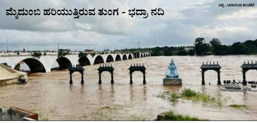
ಮೈದುಂಬಿ ಹರಿಯುತ್ತಿರುವ ತುಂಗ - ಭದ್ರಾ ನದಿ

ತುಂಗ ಮತ್ತು ಭದ್ರಾ ಜಲಾಶಯಗಳಿಂದ 1.20 ಲಕ್ಷಕ್ಕೂ ಹೆಚ್ಚಿನ ಜನರು ಬಿಟ್ಟಿರುವುದರಿಂದ ಹರಿಹರ ಬಳಿ ತುಂಗಭದ್ರಾ ನದಿ ಮೈದುಂಬಿ ಹರಿಯುತ್ತಿದೆ. ಇದರಿಂದ ರಾಘವೇಂದ್ರ ಸ್ವಾಮಿ ದೇವಸ್ಥಾನ ಹಿಂಭಾಗ ನದಿಯ ದಡದಲ್ಲಿ ನಿರ್ಮಾಣ ಹಂತದಲ್ಲಿರುವ ತುಂಗಾರತಿ ಸ್ಥಳ ಜಲಾವೃತವಾಗಿದೆ.