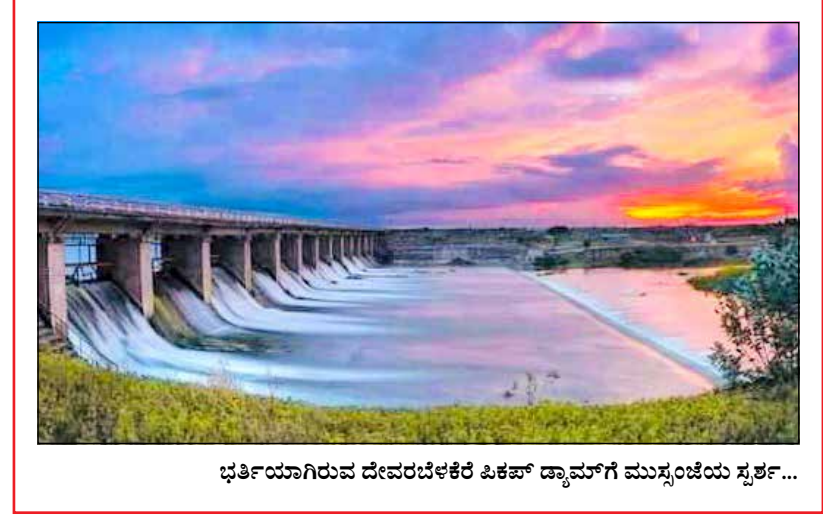
ಭರ್ತಿಯಾಗಿರುವ ದೇವರಬೆಳಕೆರೆ ಪಿಕಪ್ ಡ್ಯಾಮ್‌ಗೆ ಮುಸ್ಸುಂಜೆಯ ಸ್ಪರ್ಶ...