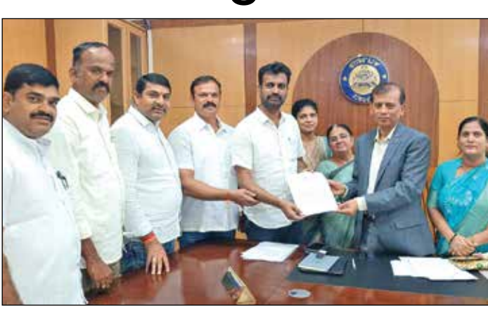
ಕಟ್ಟಡಗಳನ್ನು ಉಪಯೋಗಿಸಿಕೊಳ್ಳುವವರಿಗೆ ಸೂಕ್ತ ನಿರ್ದೇಶನ ನೀಡಲು ಮನವಿ ಮಾಡಿದರು. ಈಗಾಗಲೇ ಎರಡು ಬಾರಿ ಆಯುಕ್ತರಿಗೆ ಮನವಿ ಸಲ್ಲಿಸಲಾಗಿದೆ. ಈ ಹಿಂದೆ ಇದ್ದಂತಹ ಜಿಲ್ಲಾಧಿಕಾರಿಗಳಿಗೂ ಮನವಿ ನೀಡಿ ಜಲಸಿರಿಯ ಕಾಮಗಾರಿ ಪೂರ್ಣಗೊಂಡು, ಸಮರ್ಪಕ ನೀರು ವಿತರಣೆ ಆಗುವವರೆಗೂ ಜಲಸಿರಿ ಯೋಜನೆಯಡಿ ಬಿಲ್ ಸಾರ್ವಜನಿಕರಿಗೆ ವಿತರಿಸುತ್ತಿದ್ದು, ಸಾರ್ವಜನಿಕರಿಗೆ ಸರಬರಾಜು ಮಾಡಲು ಅಗತ್ಯ ಕ್ರಮ

ದಾವಣಗೆರೆ, ಜು. 23- ಮಹಾನಗರ ಪಾಲಿಕೆ ವಿರೋಧ ಪಕ್ಷದ ನಾಯಕರು, ಉಪ ಮಹಾಪೌರರ ನೇತೃತ್ವದಲ್ಲಿ ಬಿಜೆಪಿ ಸದಸ್ಯರ ನಿಯೋಗವು ಜಿಲ್ಲಾಧಿಕಾರಿಗಳನ್ನು ಭೇಟಿ ಮಾಡಿ, ಪಾಲಿಕೆಯ ಹಲವಾರು ಸಮಸ್ಯೆಗಳ ಕುರಿತು ಚರ್ಚೆ ನಡೆಸಿದರು. ಈ ಸಂದರ್ಭದಲ್ಲಿ ಸ್ಟಾರ್ಟ್ ಸಿಟಿ ವತಿಯಿಂದ ನಿರ್ಮಾಣಗೊಂಡು, ಉದ್ಘಾಟನೆ ಯಾಗಿ ಒಂದು ವರ್ಷ ಕಳೆದರೂ ಕೂಡ ಖಾಸಗಿ ಬಸ್ ನಿಲ್ದಾಣವನ್ನು ಸ್ಥಳಾಂತರಿಸಲು ಪಾಲಿಕೆ ಕ್ರಮ ಕೈಗೊಂಡಿರುವುದಿಲ್ಲ. ಕೂಡಲೇ ಖಾಸಗಿ ಬಸ್ ನಿಲ್ದಾಣ ಮತ್ತು ಕೆಎಸ್ಆರ್‌ಟಿಸಿ ಬಸ್ ಮೈದಾನದಿಂದ ನೂತನವಾಗಿ ನಿರ್ಮಾಣ ಗೊಂಡಿರುವ ಬಸ್ ನಿಲ್ದಾಣಗಳಿಗೆ ಸ್ಥಳಾಂತರಿಸುವ ಮೂಲಕ ಸಾರ್ವಜನಿಕರಿಗೆ ಅನುಕೂಲ ಮಾಡಿಕೊಡ ಬೇಕೆಂದು, ಯೋಜನೆಯಿಂದ ನಿರ್ಮಾಣ ಗೊಂಡ