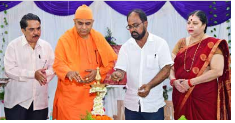
ಮಾನವಿಯತೆಯ ಗುಣ ಬೆಳೆಸಿಕೊಳ್ಳಬೇಕೆಂದು ಸಲಹೆ ನೀಡಿದರು.

ಇಂದಿನ ಮಕ್ಕಳಿಗೆ ಮರೀಚಿ ಶಿಕ್ಷಣದೊಂದಿಗೆ ವ್ಯಕ್ತಿತ್ವ ವಿಕಸನ ಶಿಕ್ಷಣವೂ ಮುಖ್ಯವಾಗಿದೆ. ಆದ್ದರಿಂದ ಮಕ್ಕಳು ಆತ್ಮೀಯತೆ, ಬಾಧ್ಯವ್ಯ ಮತ್ತು