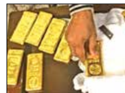
ಬಂಗಾರದ ಚೊತೆಗೆ ಎರಡು ಮೊಬೈಲ್ ಫೋನ್, ಒಂದು ಬೈನಾಕ್ಯುಲರ್, ಎರಡು ಚಾಕು ಹಾಗೂ ಹಲವಾರು ಚೀನಾ

ಲೇಹ್, ಜು. 10 - ಭಾರತ ಚೀನಾ ವ್ಯಾಪ್ತಿಕೆ ಗಡಿ ರೇಖೆ ಬಳಿ 108 ಕೆಜಿ ಬಂಗಾರವನ್ನು ಇಂಡೋ ಟಿಬೆಟಿಯನ್ ಗಡಿ ಪೊಲೀಸರು (ಐ.ಟಿ.ಬಿ.ಪಿ.) ವಶಪಡಿಸಿಕೊಂಡಿದ್ದಾರೆ. ಒಟ್ಟು 108 ಬಂಗಾರದ ಗಟ್ಟಿಗಳನ್ನು ವಶಪಡಿಸಿಕೊಳ್ಳಲಾಗಿದ್ದು ಪ್ರತಿಯೊಂದು ಗಟ್ಟಿ ಒಂದು ಕೆಜಿ ತೂಕದ್ದಾಗಿವೆ. ಕಳ್ಳಸಾಗಣೆ ಮಾಡಲಾಗುತ್ತಿದ್ದ