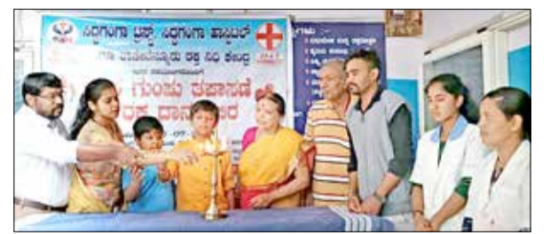
ರಾಣೇಬೆನ್ನೂರು ರಕ್ತದಾನದ ತಪ್ಪು ಕಲ್ಪನೆಯಿಂದ ಹೊರಬಂದು ರಾಣೇಬೆನ್ನೂರು