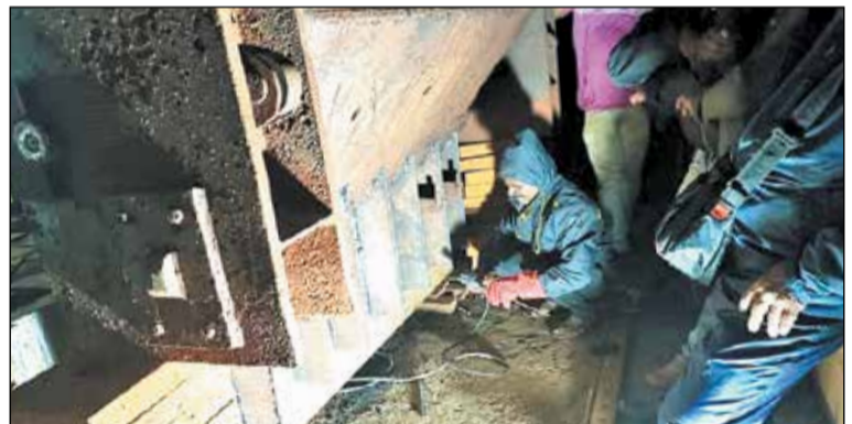
ಭದ್ರಾ ಜಲಾಶಯದಲ್ಲಿನ ನದಿಮಟ್ಟದ ಸ್ಪೂಯೀಸ್ ಗೇಟ್ ದುರಸ್ತಿ ಕಾರ್ಯದಲ್ಲಿ ಸಿಬ್ಬಂದಿ

ಶಿವಮೊಗ್ಗ, ಜು. 7 - ಭದ್ರಾ ಜಲಾಶಯದ ಮಾಡಲಾಗಿದೆ ಎಂದು ಭದ್ರಾ ಅಧೀಕ್ಷಕ ತಳಮಟ್ಟದ ಗೇಟ್‌ನಲ್ಲಿ ಉಂಟಾಗಿದ್ದ ತಾಂತ್ರಿಕ ದೋಷವನ್ನು ಸರಿಪಡಿಸುವ ಕೆಲಸ ಭಾನುವಾರ ಈ ಕುರಿತು ಅವರು ಭಾನುವಾರ ಸಂಜೆ ಪರಿಶೀಲನೆಗೊಂಡಿದ್ದು, ಜಲಾಶಯದ ಪವರ್ ಹೊರ ಹೋಗುತ್ತಿದ್ದ ನೀರನ್ನು ಬಂದ್