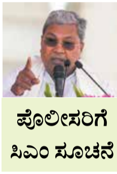
ಪೊಲೀಸರಿಗೆ ಸಿಎಂ ಸೂಚನೆ

ಬೆಂಗಳೂರು, ಜು. 6 - ಡ್ರಗ್ಸ್ ಮಾರುವವರು, ರೌಡಿಗಳು ಹಾಗೂ ರಿಯಲ್ ಎಸ್ಟೇಟ್ ದಂಧೆ ನಡೆಸುವವರು ಯಾರು ಎಂಬುದು ಆಯಾ ಠಾಣಾಧಿಕಾರಿಗಳಿಗೆ ಗೊತ್ತಿದ್ದರೂ ಇದನ್ನು ತಡೆಯಲು ವಿಫಲರಾಗಿದ್ದರೆ ಎಂದು ಮುಖ್ಯಮಂತ್ರಿ ಸಿದ್ದರಾಮಯ್ಯ ಪೊಲೀಸ್ ಅಧಿಕಾರಿಗಳಿಗೆ ಚಾಟಿ ಬೀಸಿದ್ದಾರೆ. ಪೊಲೀಸ್ ಮಹಾನಿರ್ದೇಶಕರ ಕಚೇರಿಯಲ್ಲಿ 2024ರ ಹಿರಿಯ ಪೊಲೀಸ್ ಅಧಿಕಾರಿಗಳ ಸಮಾವೇಶ ಉದ್ಘಾಟಿಸಿ, ನೂತನ ತಂತ್ರಾಂಶ ಬಿಡುಗಡೆ ಮಾಡಿ ಮಾತನಾಡಿದ ಅವರು, ನಿಮಗೆ ಗನಗಳನ್ನು ಕೊಟ್ಟಿರುವುದು ಏತಕ್ಕೆ, ಕಿಸೆಯಲ್ಲಿ ಇದುವುದಕ್ಕಲ್ಲ, ರೌಡಿಗಳನ್ನು ಎದುರಿಸಲಿಕ್ಕೆ ಎಂದರು. ರೌಡಿಗಳಲ್ಲಿ ಭಯ ಹುಟ್ಟಿಸುವ ಕೆಲಸ ಮಾಡಬೇಕು, ಕೆಳಗಿನ ಅಧಿಕಾರಿಗಳು ಇನ್ನಷ್ಟು (5ನೇ ಪುಟಕ್ಕೆ)