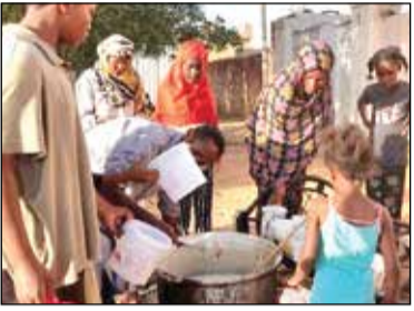
ಈ ಸಂಘರ್ಷದಿಂದಾಗಿ ಲಕ್ಷಾಂತರ ಜನರು ಕ್ವಾಮದ ಭೀತಿ ಎದುರಿಸುತ್ತಿದ್ದಾರೆ. ಸೂಡನ್ ಸಂಘರ್ಷದಲ್ಲಿ ತೊಡಗಿರುವವರು ಜನರ ಬಳಲುವಿಕೆಯನ್ನೇ ಅಸ್ತಮಾಡಿಕೊಂಡಿದ್ದಾರೆ ಎಂದು ವಿಶ್ವಸಂಸ್ಥೆಯ ಸ್ವತಂತ್ರ ಪರಿಣಿತರು ಆರೋಪಿಸಿದ್ದಾರೆ. ಸಿಂಗಾದಲ್ಲಿ ಅರೆಸೇನಾ ಪಡೆಗಳು ವ್ಯಾಪಕವಾಗಿ ಲೂಟಿ ನಡೆಸಿವೆ. ಖಾಸಗಿ ವಾಹನ, ಮೊಬೈಲ್ ಫೋನ್, ಆಭರಣ ಹಾಗೂ ಇತರ ಅಮೂಲ್ಯ ವಸ್ತುಗಳನ್ನು

ಕೈರೋ, ಜೂ. 30 - ಸೂಡಾನ್ ಸೈನ್ಯ ಹಾಗೂ ಅರೆಸೇನಾ ಪಡೆಗಳ ನಡುವೆ ಮಧ್ಯ ಪ್ರಾಂತ್ಯದಲ್ಲಿದ್ದ ಸಂಘರ್ಷ ಭುಗಿಲೆದ್ದಿದೆ. ಇದರೊಂದಿಗೆ 14 ತಿಂಗಳ ಅಂತರ್ಯುದ್ಧ ಹೊಸ ಸ್ವರೂಪ ಪಡೆದುಕೊಂಡಿದೆ. ಅಧಿಕಾರದ ದೇಶವಾದ ಸೂಡಾನ್ ಈಗ ಕ್ವಾಮದ ಅಂಚಿಗೆ ಬಂದು ನಿಂತಿದೆ. ಅರೆಸೇನಾ ಪಡೆಗಳು ಸೈನ್ಯ ಪ್ರಾಂತ್ಯದಲ್ಲಿ ದಾಳಿ ಆರಂಭಿಸಿವೆ. ಅರೆಸೇನಾ ಪಡೆಗಳು ಪ್ರಾಂತ್ಯದ ರಾಜಧಾನಿ ಸಿಂಗಾ ಕಡೆಗೆ ತೆರಳುತ್ತಿವೆ. ಸಿಂಗಾದಲ್ಲಿರುವ ಸೈನ್ಯದ 17ನೇ ಪಡಾತಿ ದಳದ ಕೇಂದ್ರಗಳನ್ನು ವಶಪಡಿಸಿಕೊಂಡಿರುವುದಾಗಿ ಅರೆಸೇನಾ ಪಡೆಗಳು ತಿಳಿಸಿದ್ದವು. ಆದರೆ, ಈ ಕೇಂದ್ರವನ್ನು ಮರು ವಶಪಡಿಸಿಕೊಂಡಿರುವುದಾಗಿ ಸೈನ್ಯದ ವಕ್ತಾರ ಬಿಗೋಡಿಯರ್ ನಬಿಲ್ ಅಬ್ದುಲ್ಲಾ ಹೇಳಿದ್ದಾರೆ. ಭಾನುವಾರ ಬೆಳಿಗ್ಗೆಯಿಂದಲೂ ಸಂಘರ್ಷ ನಡೆಯುತ್ತಿದೆ.