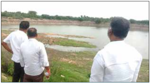
ಮಲ್ಲಶೆಟ್ಟಿಹಳ್ಳಿ ಜಾಕ್ ವೆಲ್ ಕಮ್ ಪಂಪ್ ಹೌಸ್-2ಗೆ ಭೇಟಿ ನೀಡಿ ಪರಿಶೀಲನೆ