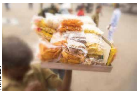
ಅವಧಿ ಮೀರಿದ ಆಹಾರ ಮಾರಾಟ, ಸ್ವಚ್ಛತೆ ಕೊರತೆ ಸೇರಿದಂತೆ ಉದಾಹರಣೆಗಳನ್ನು ಸಂಪದಿಸಿಕೊಳ್ಳಲು ಸೂಚನೆ

ಬೆಂಗಳೂರು, ಜೂ. 19 - ರಾಜ್ಯದ ಬಸ್ ನಿಲ್ದಾಣಗಳಲ್ಲಿನ ವ್ಯಾಪಾರ ಮಳಿಗೆಗಳು ಮತ್ತು ಆಹಾರ ಉದ್ಯಮಗಳಲ್ಲಿ ಅವಧಿ ಮೀರಿದ ಆಹಾರ ಮಾರಾಟ ಹಾಗೂ ಸ್ವಚ್ಛತೆ ಕೊರತೆ ಸೇರಿದಂತೆ ಹಲವು ಉದಾಹರಣೆಗಳನ್ನು ಸಂಪದಿಸಿಕೊಳ್ಳುವುದರ ಅಂತಹ ಉದ್ಯಮಗಳ ಮಾಲೀಕರ ವಿರುದ್ಧ ಕ್ರಮಕೈಗೊಳ್ಳಲಾಗುವುದು ಎಂದು ಸರ್ಕಾರ ಎಚ್ಚರಿಕೆ.