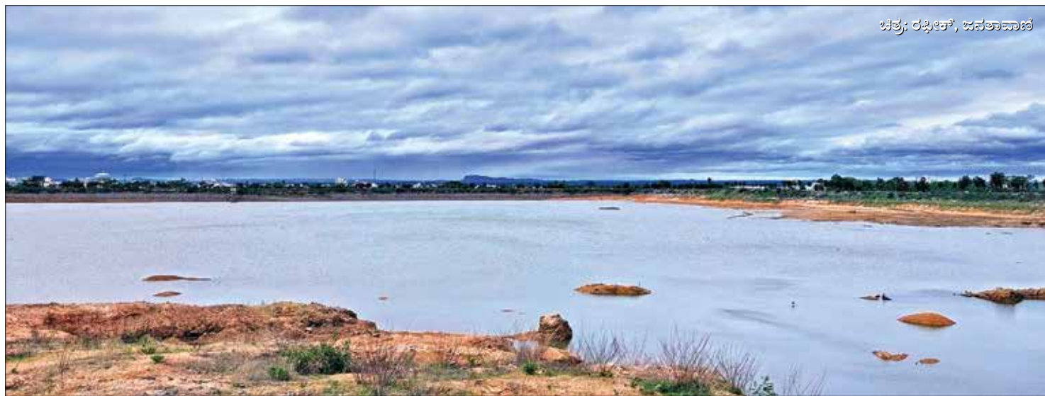
ಬರಿದಾಗುತ್ತಿದೆ ಟಿವಿ ಸ್ಟೇಷನ್ ಕೆರೆ ಮುಂಗಾರು ಮಳೆ ಚುರುಕಾಗಿದೆ. ಇತ್ತ ನಗರದ ಕೆಲವು ವಾರ್ಡುಗಳಿಗೆ ನೀರು ಸುಸ್ತು ಟಿವಿ ಸ್ಟೇಷನ್ ಕೆರೆ ಬರಿದಾಗಲಾರಂಭಿಸಿದೆ. ಸದ್ಯ ಈ ಭಾಗದಲ್ಲಿ 8 ದಿನಗಳಿಗೂ ಮೈ ನೀರು ನೀಡಲಾಗುತ್ತಿದೆ. ನೀರು ಹರಿಸುವ ಸಮಯವನ್ನೂ ಇಳಿಕೆ ಮಾಡಲಾಗಿದೆ.