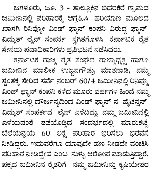
ಚಿಟುವಟಿಕೆಗೆ (ಎನ್ ಎ) ಅನುಮತಿಗೆ ಅರ್ಜಿ ಸಲ್ಲಿಸಿದ್ದು ಸಾತ ಕಂಪನಿ ತೆರವು ಸುತ್ತಮುತ್ತ ನಿರುದ್ಯೋಗಿಗಳಿಗೆ ಉದ್ಯೋಗ ಕಲ್ಪಿಸಲು ಉದ್ದೇಶ ಹೊಂದಲಾಗಿದೆ.